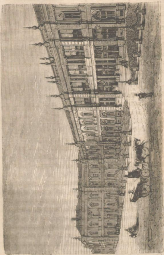
NOUVELLE FAÇADE DE CASINO, A BADEN-BADEN.