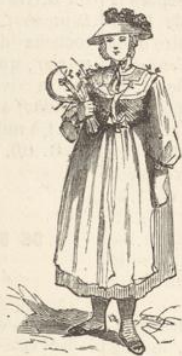
Paysanne de Kirnbach.

1 4/10 mil. Wolfach, où l'on rejoint la route ci-dessus décrite, § 1.