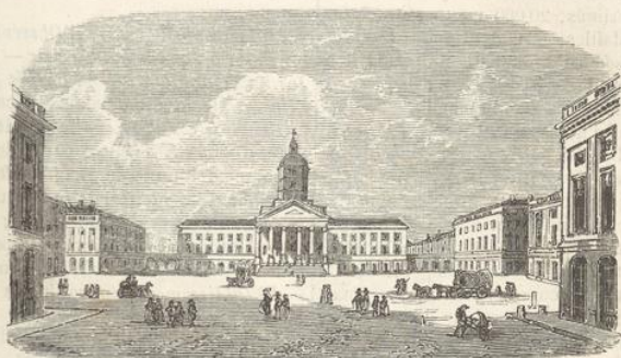
La place Royale, à Bruxelles.

deux angles de la façade d'une tournelle octogone terminée par une aiguille en pointe. Cette façade (80 mètr. de longueur) se compose au rez-de-chaussée d'un portique de dix-sept arcades ogivales, supportant une plate-forme au-dessus de laquelle s'élèvent deux étages de fenêtres rectangulaires, surmontés eux-mêmes d'un toit très-élevé, percé de quatre rangs de lucarnes. Au-dessus de la grande porte s'élève une tour (91 mètr. 63 cent. de haut.) carrée jusqu'au sommet des toits, et