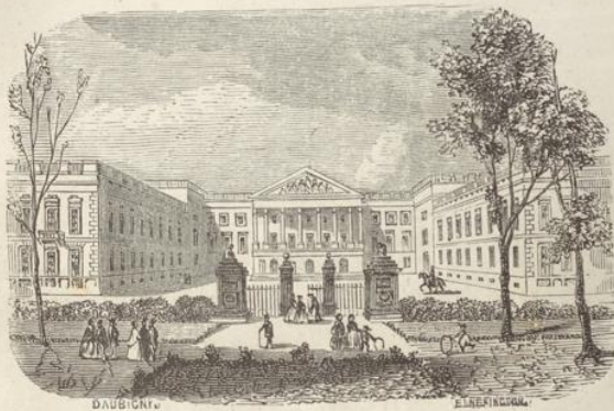
Palais de la Représentation nationale à Bruxelles.

L'église Saint-Jacques sur-Cau-denberg (XVIII e s.) offre un portique de six colonnes d'ordre corinthien, supportant un fronton triangulaire orné d'une fresque. — L'église Notre-Dame des Victoires ou du Sablon , la plus belle église ogivale de Bruxelles, après Sainte-Gudule, date du xv e et du xvii e s. Un beau porche à profondes voussures concentriques et une vaste fenêtre flamboyante décorent l'entrée principale; l'intérieur renferme les