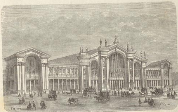
Gare du chemin de fer du Nord à Paris.

A Aachen. V. Aix-la-Chapelle, 452. Acre, 133. Aden, 215. Adharren, 173. Aden, 544. Aden, 544. Aden, 544. Aden (villes de l'), 606. Aden, 607. Aden (château d'), 612. Aix-la-Chapelle, 652. Alb (l'), 283. Albrück, 151. Albrück, 382. Albrück, 552. Albrück, 650. Albrück, 550. Albrück, 556. Albrück, 204. Albrück, 281. Albrück, 386. Albrück, 434. Albrück, 418. Albrück, 173. Albrück, 173. Albrück, 604. Albrück, 655. Albrück (abbaye d'), 612. Albrück (château d'), 612. Albrück, 609. Albrück, 203. Albrück, 204. Albrück, 204. Albrück (l'), 422. Albrück, 428. Albrück, 518. Albrück, 501. Albrück, 431. Albrück (l'), 222. Albrück, 443. Albrück, 483.