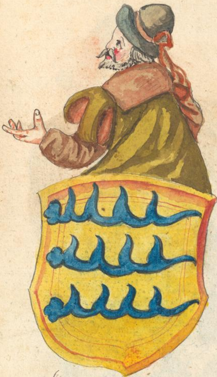
Sigmund Herzog zu Inub.

Ino fñal iud Goygnboru hno Dignmnd von Botth quadru Herzog zu Inub, Vni- - land Herzogru Ludwigs der Hinobru Dofu, iud käpft gnuallt fbarfandru Brüdra. Originol No: In 1538.