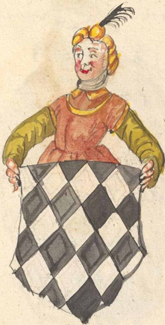
Agunb gnobofrun Gnozogin zu Inck.