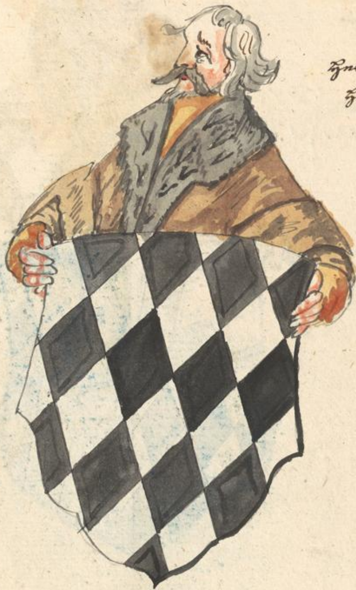
Inomann Ino aucto Gnozog zu Inckf.