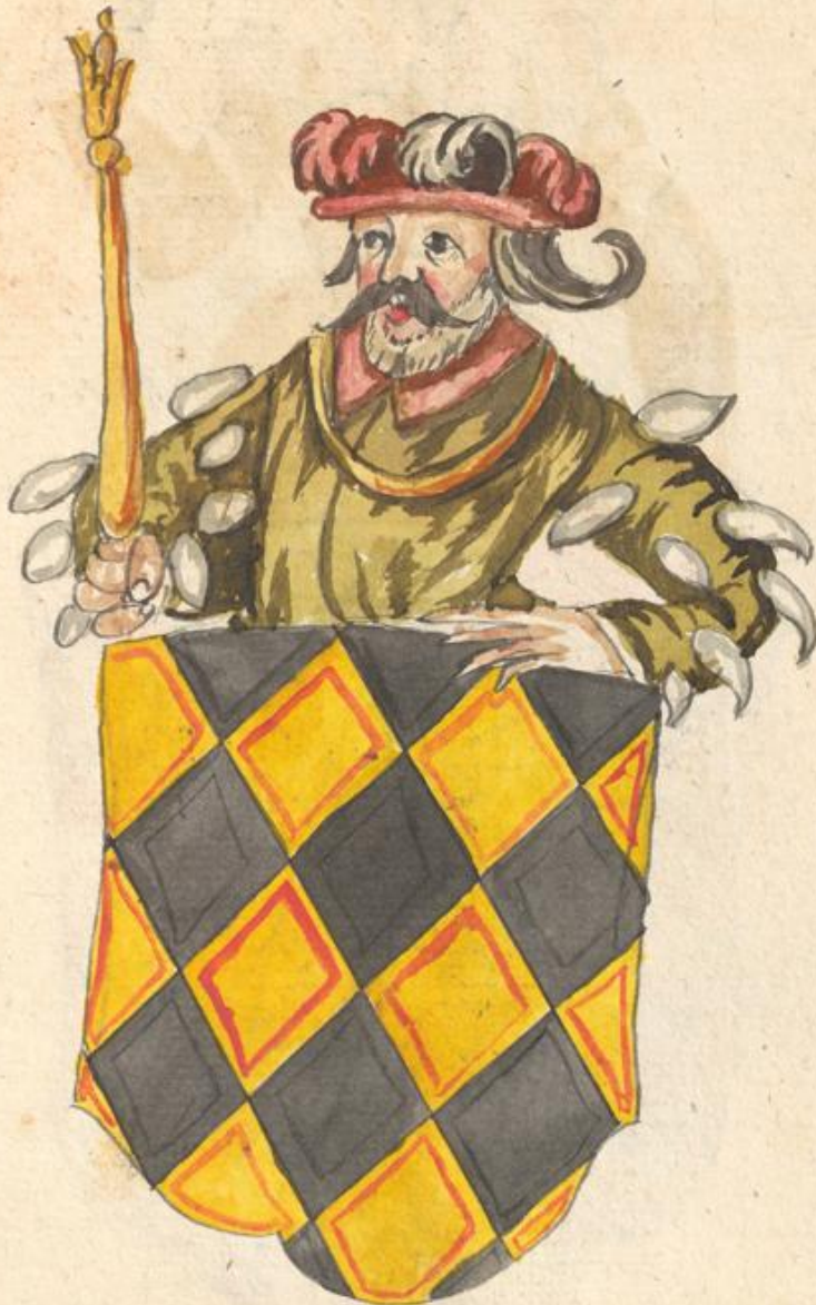
Ulrich Herzog von Teck.