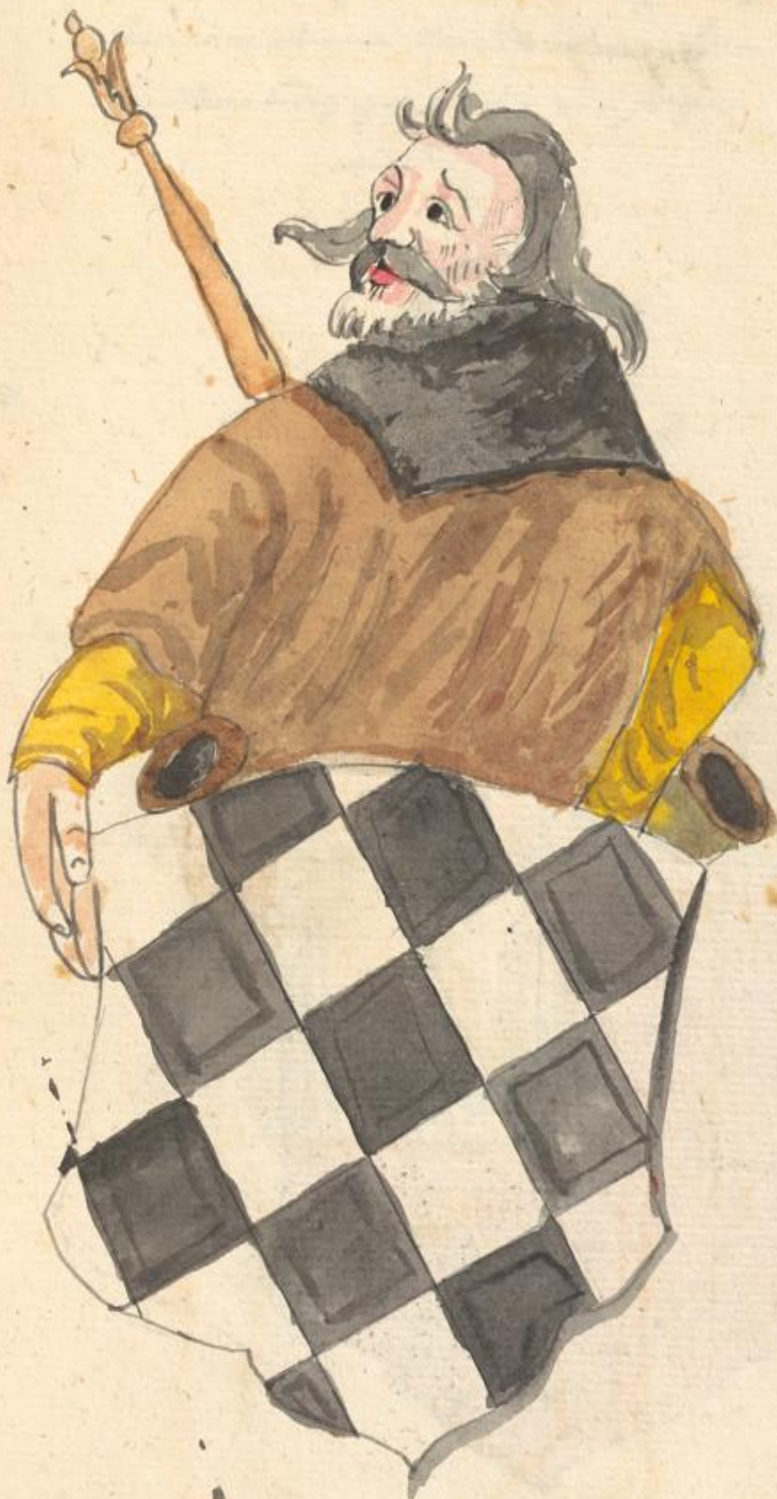
Lüdriegg Herzog zün Inckel.

Inr dünsflüchtig Forfgebore Züft und Zner, Inr Lüdriegg Herzog zün Inckel, Anno Domini 1204 ist gwonfen nür Dofu graf Albot Inr ältten zün Inckel.