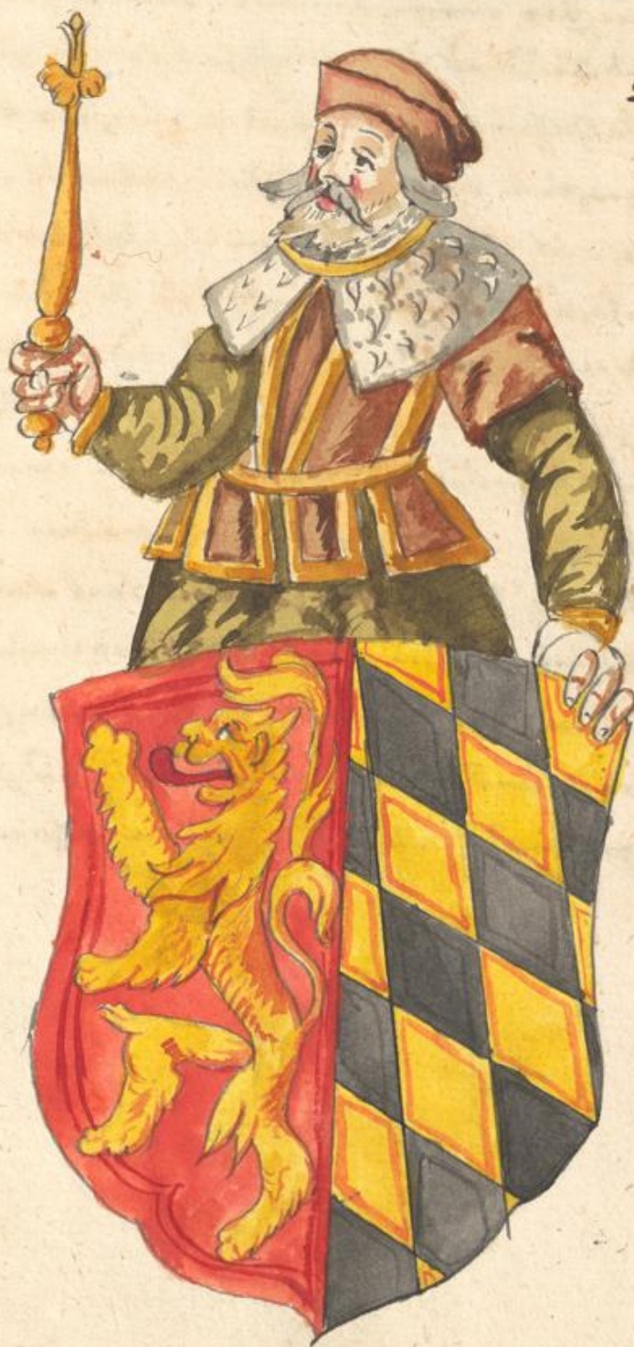
Ludwig Herzog von Sach S.