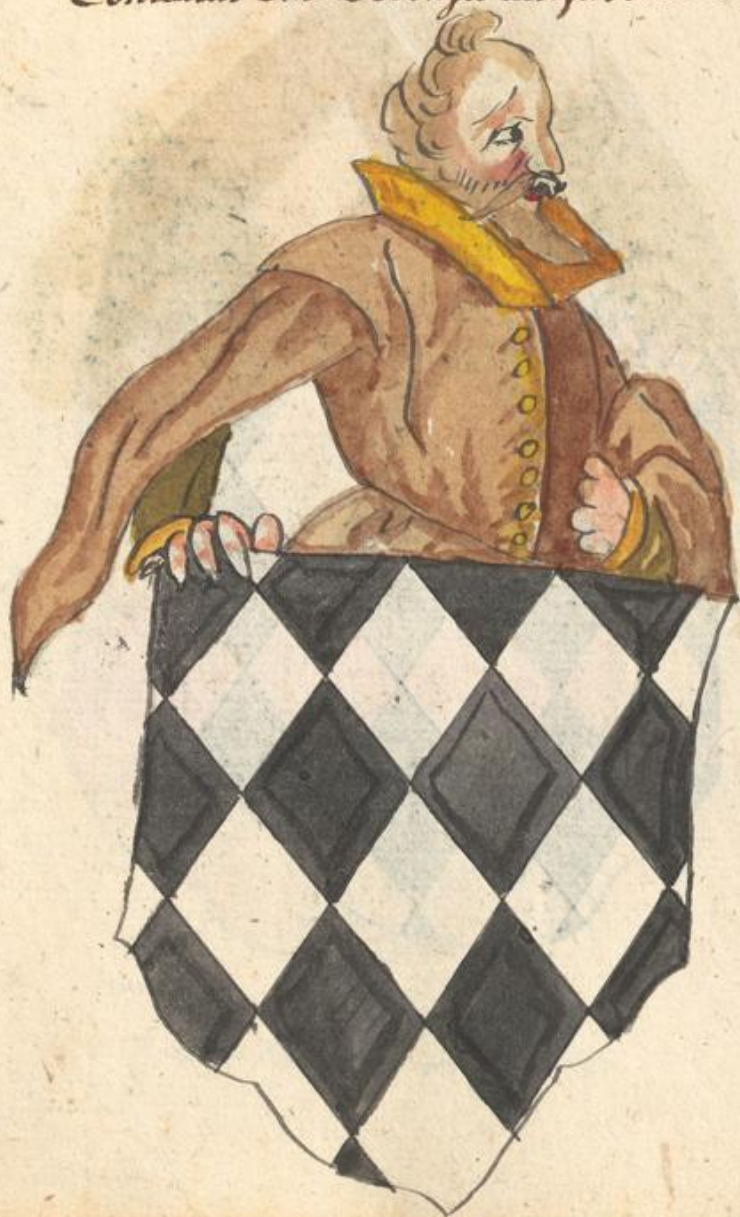
Conrad Herzog zu Innebf.

Conradus Dux Borensis acifus Monaci 1352.