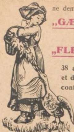
Marque déposée „Genseliesel“

Fabrique Strasbourgeoise de Pâtes alimentaires aux œufs