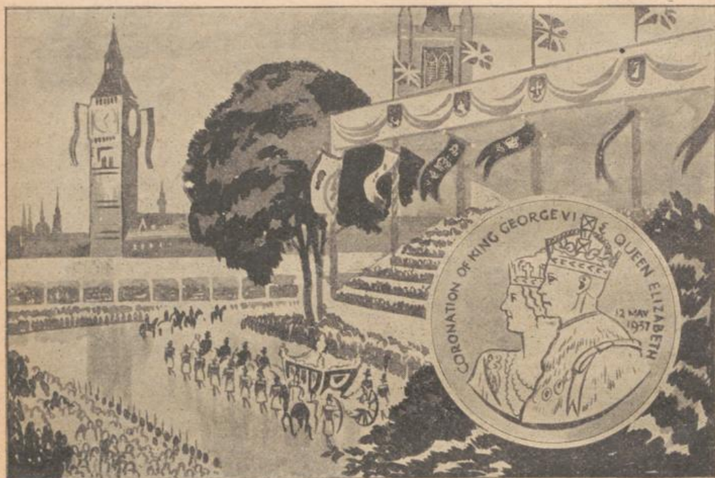
Kronung des Königs Georg VI. und der Königin Elisabeth v. England — 12. Mai 1937.

Wie und wann wird der schreckliche Bürgerkrieg enden, der nun bald ein