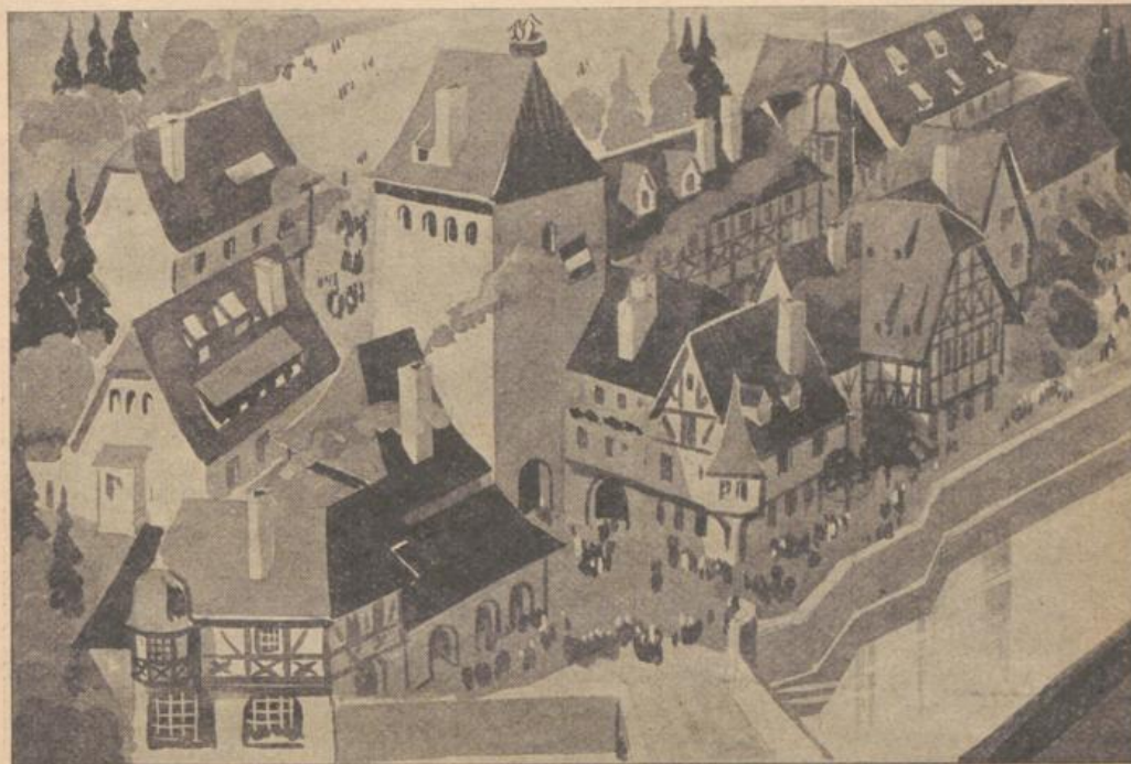
Internationale Weltausstellung 1937 Paris — Das elsässische Dorf.

In England begann das Jahr 1936 mit dem Ableben seines geliebten Herrschers und endete mit der Abdankung dessen Nachfolgers: Die Regierungsdauer des Ersten — George V. — war