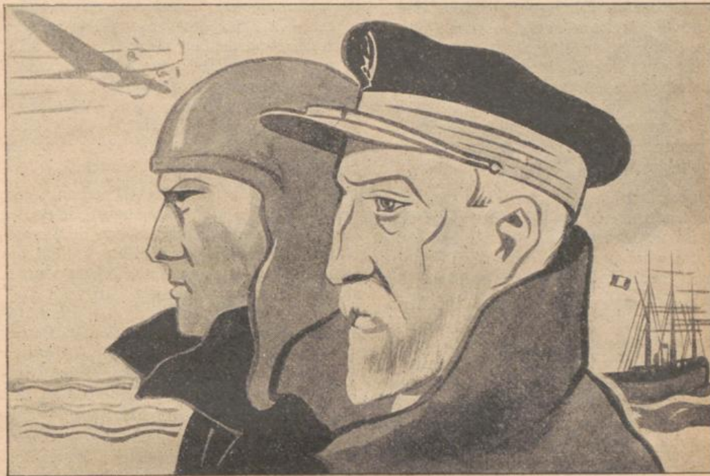
Mermoz und sein Flugzeug « Arc-en-Ciel ». — Charcot und sein Dreimaster « Pourquoi-pas ? »

In den Vereinigten Staaten ward Präsident Roosevelt mit erdrückender Stimmenmehrheit wiedergewählt, worüber wir uns in jeder Hinsicht freuen; zumal dieser Friedensapostel unser