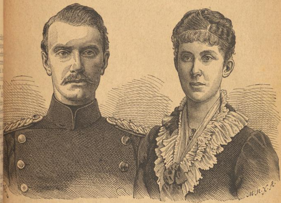
Erzogroßherzog Friedrich von Baden und seine Braut Prinzessin Hilba von Nassau.

Die vereinigten Staaten Nordamerikas haben mit dem 4. März 1885 die Person ihres Bundesprä- sidenten gewechselt. Die Einsetzung des neugewählten Präsidenten Stephen Grover Cleveland ist mit großem Pompe erfolgt. Seit 24 Jahren zum ersten mal wurde die republikanische Partei von der demokra- tischen bei der Präsidentenwahl geschlagen. Cleve- lands Regierungsthätigkeit hat bis heute weder im