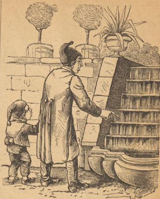
Jetzt do gugscht Bua, was se in der Residenz f' Geld verschwende, bauet se em Wasser no Staffle, bei uns kommt's alloi de Berg ra.

e ich in einem Dörfchen im Kanton Neuenburg ch dort der einzige Deutsche war, so lernte ich zöfische Sprache fast spielend. Ein alter ater hatte mir früher das Lesen und Schreiben zöfischen beigebracht, nun lernte ich perfekt , so daß ich es bald mit jedem ächten Franzosen nmen hätte. Die Sehnsucht nach Deutschland ich fort. Mit Mitteln reichlich versehen ging Rhein hinunter nach Köln, später nach Ham- arbeitete auf dem Rückwege in Frankfurt und the und als die Zeit herannahte, es war in enen Spätherbste 1865, wo ich zur Konstri- m mußte, packte ich meine sieben Zwetschgen en und wanderte durch das badische Länd- auf, es war zu schön zum fahren und ich noch Zeit genug zum Heimkommen. Das war damals, wie Sie ja selber wissen, prach- tlich der Morgen, heiß der Mittag, warm nd bis in die Nacht hinein. Ich wanderte t weiter, war gesund an Leib und Seele, ein hübscher Bursche, dazu Geld genug im aheim warteten meiner liebende Eltern, was ch noch mehr? Die Liebe kannte ich damals ht so recht. Wohl gab mir manches schöne verstehen, daß ich nicht vergebens anklopfen aber mein Stündlein hatte eben noch nicht ge-