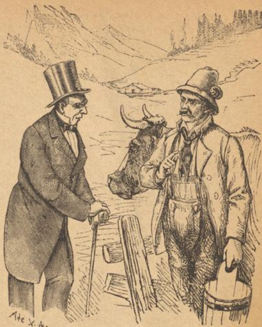
Der Herr Rath in der Sommerfrische: „Ist aber doch ein trauriges Loos, lieber Mann, so immer und alle Tage nur mit Kühen umzugehen.“ Küchler: „Ja wohl, Herr Rath, aber se fan mer doch lieber als Ihne Ihre Alten.“

Ein Eindruck, welchen das Gesamtbild der revolu- ren Regierung des badischen Seekreises darbot, gerade kein imponirender. Der größte Theil der ieder war anscheinend an einem mit Schriften affen überdeckten Tisch beschäftigt, andere unter- n sich flüsternd in den tiefen Fensternischen und est saß rittlings auf Sesseln, die unregelmäßig ent in dem großen Zimmer umher standen. Alle befürzt, bleich, übernächtigt, angegriffen aus. er Abgesandte wurde bei seinem Eintritt in das ngszimmer mit verschiedenen Ausrufen, Be- ungen, Fragen bestürmt und vermochte erst, em die Klingel des Vorsitzenden zur Ordnung en, sich seines Auftrages zu entledigen. Er