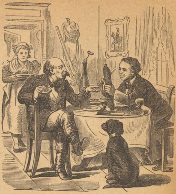
Neffe (bei seinem Onkel Gutsverwalter): Sagen Sie mir, Herr Onkel, ist es einerlei wo ich die Wurst anschneide? Onkel: Ganz nach Deinem Belieben, lieber Neffe. Neffe: Na, dann werde ich die Wurst zu Hause anschneiden.

„Versteht sich; so heißt's! Heinze, Bureauvorsteher.“