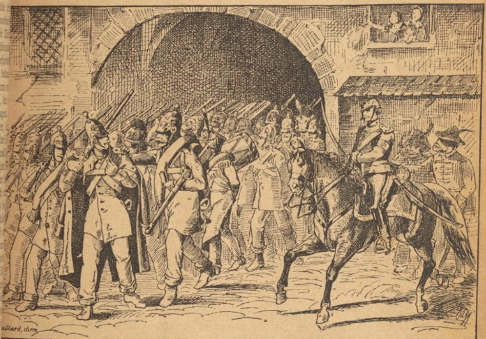
Unter dem Thore erschienen die gelbgrauen Mäntel der badischen regulären Truppen.

Die Macht der Disziplin welche ein plötzlich gesprochenes besonnenes Kommando auf gebiente Soldaten in allen Lagen ausübt und ausüben muß, wirkte auch hier. Rasch faßten sich die so schwer geprüften Krieger, formirten mit gewohnter Schnelligkeit ihre Reihen und überschritten mit gesenktem Gewehr, dem Kommandowort des fremden Offiziers gehorchend, die