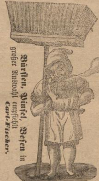
Streifen, Hütel, Seifen in großer Auswahl empfiehlt Carl-Fischer.

BERLINER NEUESTE NACHRICHTEN Unparteiische Zeitung Billigste Berliner Zeitung Täglich auch Montags Probennummern gratis u. franco