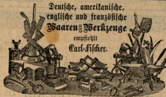
Deutsche, amerikanische, englische und französische Waaren- und Werkzeuge empfehlen Carl-Fischer.

NB. Ich mache meine werthen Kunden darauf aufmerksam, daß sämtliche Sachen mit sehr guten Zuthaten versehen und sehr gut gearbeitet sind. [1561]