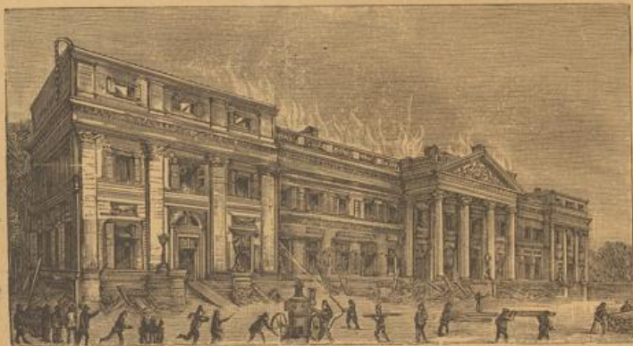
Brand des belgischen Königsschlosses Laeken.

Arbeitseinstellungen statt. Gegen 20,000 Mann legten die Arbeit nieder, so daß mehrere Fabriken feiern mußten wegen Kohlenmangel. — Am Neujahrstage 1890 brannte das prächtige königliche Lustschloß Laeken bei Brüssel vollständig nieder. König Leopold mit der Königin und den Prinzen hielten eben den üblichen Neujahrsempfang im Schlosse zu Brüssel ab, während Prinzessin Klementine mit ihrer Erzieherin im Schlosse Laeken weilten. Die Prinzessin wurde gerettet, die Erzieherin aber wollte aus ihrem Zimmer noch einiges holen und kam in den Flammen um. Schloß Laeken wurde vom Statthalter Belgiens unter österreichischer Herrschaft erbaut, im Jahre 1792 von den Truppen des französischen Generals Dumouriez geplündert und später von Napoleon I. erworben. Im Jahre 1831 erhielt der neue König der Belgier Schloß Laeken als Wohnung zuge-