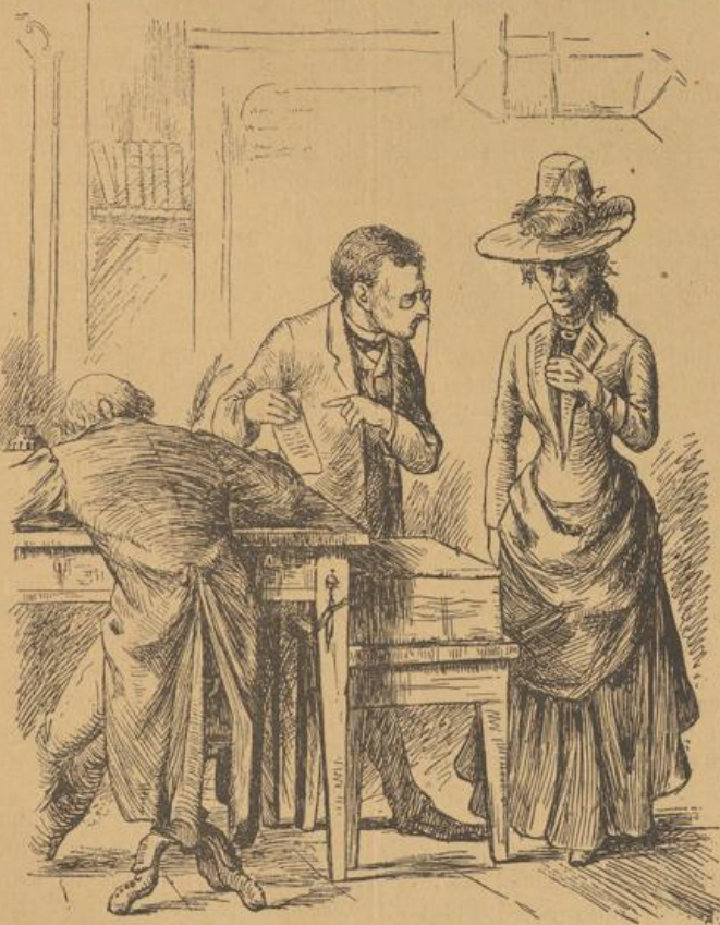
Have Sie den Brief g'schriwe?

„Non, Herr Amtmann“ — sächt jez die Hulda, denn se hot ihr Briefmabb' mit dem Kunzebt uf 'm Disch liege sehe un hot wohl gewißt, daß do