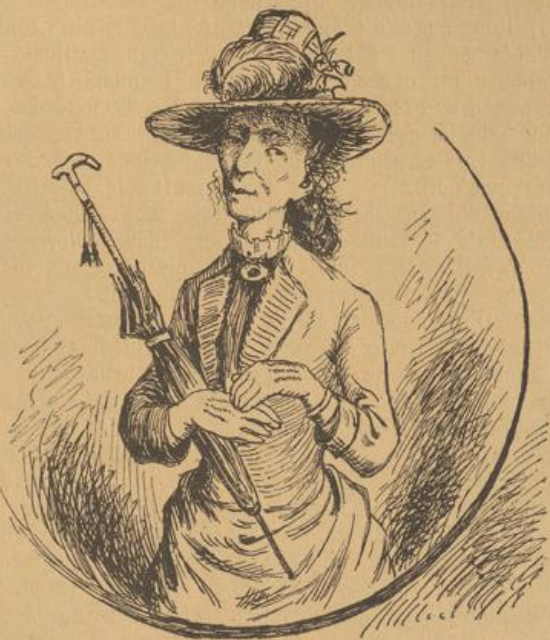
Die hold' Hulda.

nor eenzig un alleen abg'sehe g'hatt, dann wiewoll sie ihrem Alder nooch zärdliche Anwandlungen längscht hätt' iverwunne have könne, so hot se halt doch alsefort noch e waarm's Herz g'hatt — was wörtlich genumme freilich unner dem viele Watt' keen Wunner gewest is — un ihr eenzig's Ziel und Beschdrewa is gewest, sich in ihre alde Dage noch'n Mann zu angle. Derntwege is se aach alli Lageblick in'n Annere verschosse gewest — alt's un derr's Holz brennt jo, wie Schdroh, glei lichderloh — awer Feder hot nor sein Schbuhze*) mit'r gedriwe un 's is nie Keener kumme, wo emol