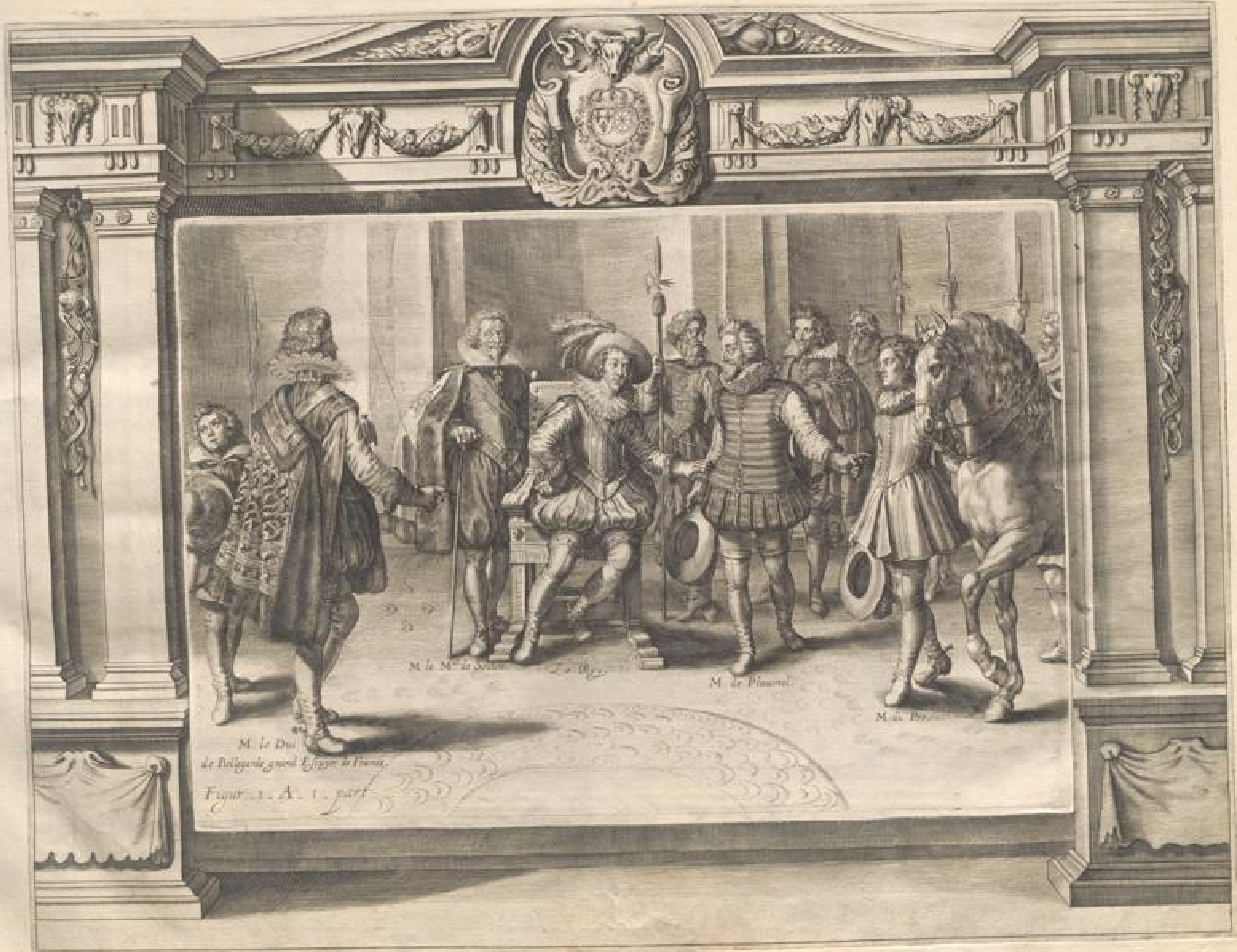
M. le Duc de Bourgogne grand Eger de France. Figur. 1. A. 1. part