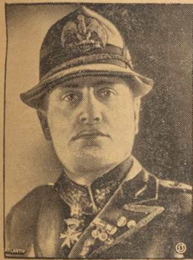
Mussolini in voller Kriegsausrüstung.

den abgeschlossenen Luftverhandlungen die verkehrstechnische Annäherung zwischen Berlin und Paris seit dem 26. Mai auf dem Luftwege, die erste nach siebeneinhalb Jahren. Man muß diese Tatsachen nicht so selbstverständlich hinnehmen, sondern man muß zurückdenken an all die Nöten und Leiden, an die Bitternisse und Bedrängnisse, an die Qual und den Haß, die langsam in zielbewußter Arbeit überwunden werden mußten bis zu diesem Ende. Dann begreift man erst den Erfolg und ist stolz darauf und überläßt neidlos selbst den erfolgreichen Flug zum Nordpol dem Oberstleutnant Byrd von der amerikanischen Flotte. Aber trotzdem drängt sich dabei der Gedanke auf: Was könnten wir Deutschen leisten, wenn