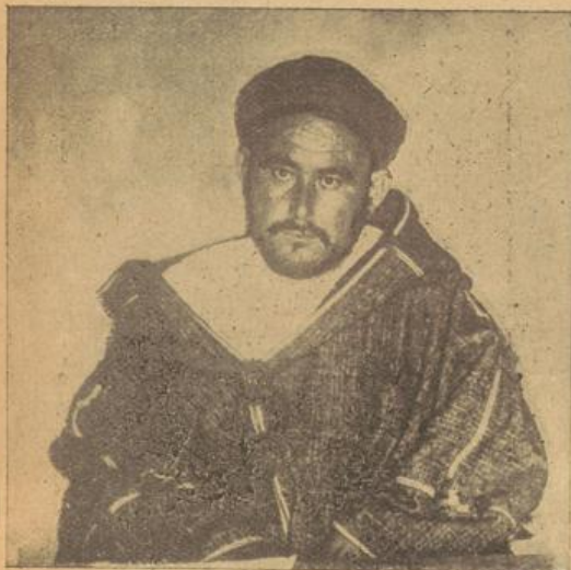
Abd-el Krim, Führer der Rißkabylen.

das grauenhafte Eisenbahnunglück beim Ostbahnhof in München am 24. Mai, das schwerste im bayerischen Eisenbahnwesen seit dem 17. April 1917, das bei Mannheim 30 Tote und 80 Verletzte gefordert hatte. Die nämliche Anzahl von Toten, meistens Ausflügler, war bei diesem Zusammenstoß zweier Personenzüge zu beklagen, die Zahl der Verletzten betrug über 70, die Hälfte davon waren Frauen. Erwähnt sei