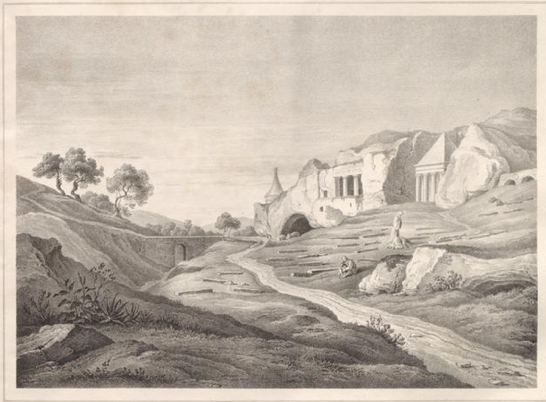
DIE GRÄBER ABSALOMS, JOSAPHATS UND ZACHARIAS, NEBST DER KIDRONBRÜCKE.