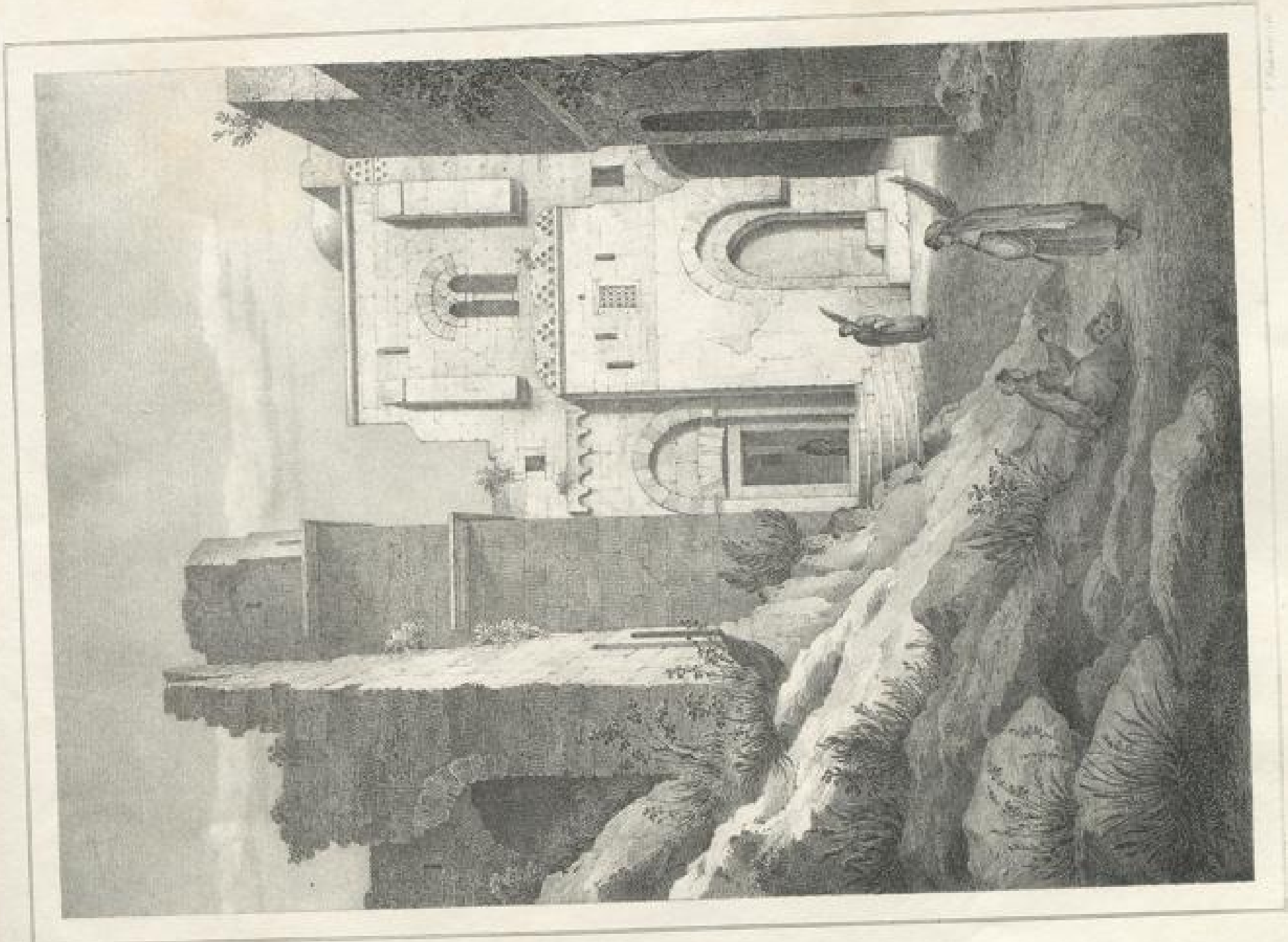
PROBEN DER ARCHITECTUR DER PALMYRENEN. BELUS TEMPEL. PALMYRA. 1753.

Verlag v. J. F. Neumann, Neudamm, in Berlin.