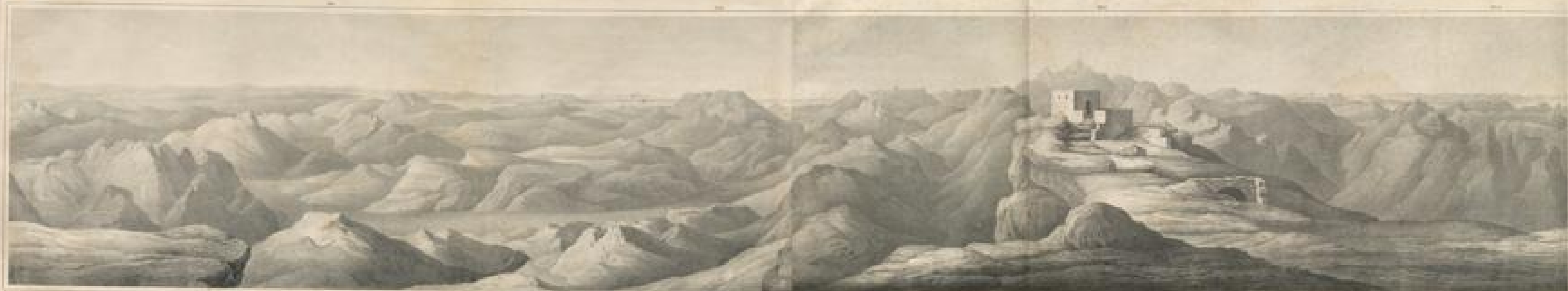
TAUERBERG VON SÜD