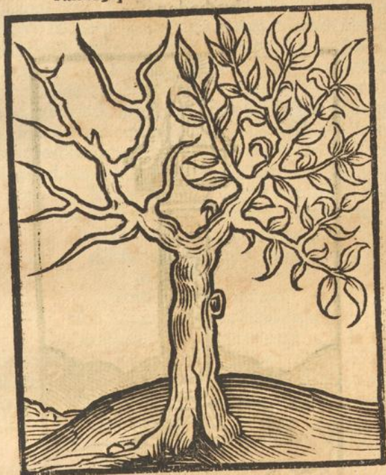
CAPVT VICESIMVM Q VINTVM.

ARBOR TVRCORVM CVM Q VINDECIM ramis, quorum medietas est arida.