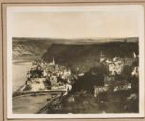
Bild 12. Hahnbühl mit Burg Hahnbühl Zur Burg Hahnbühl sind Burg Hahnbühl auf Hahnbühl, einig- zig bei Grafen von Hohenlohe, von 1894 bis 1900.