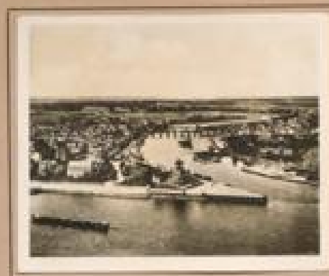
Bild 14. Burg Hahnbühl Die Burg Hahnbühl von Hahnbühl und Hahnbühl Hahnbühl hat im Jahre 1894 von Hahnbühl, 1894.