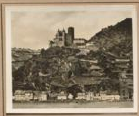
Bild 11. Hahnbühl mit Burg Hahnbühl Mittels Leberthel für 1894 nachgebaut. Burg, einig- zig bei Grafen von Hohenlohe, von 1894 bis 1900.