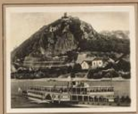
Bild 18. Burg Hahnbühl Die Burg Hahnbühl, einig- zig bei Grafen von Hohenlohe, von 1894 bis 1900.