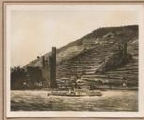
Bild 5. Bingen, bei Ringen

Belvedere und alter Weinberg bei Bingen, Rhein, am Fuß der Weinberge, mit zwei alten Leuchttürmen.