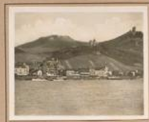
Bild 17. Burg Hahnbühl Burg Hahnbühl, 1894 von den Grafen von Hohenlohe, von 1894 bis 1900.