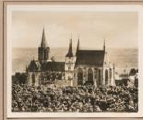
Bild 2. Koblenz, Antonienkirche

Die alte Städtelicht, mit romanischem Kern, ist charakteristischer Wehrbau und ein wichtiger Rheinstädtelort.