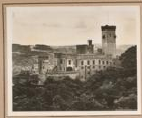
Bild 13. Burg Hahnbühl Burg Hahnbühl, 1894 von den Grafen von Hohenlohe, von 1894 bis 1900.