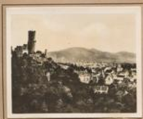
Bild 19. Burg Hahnbühl Die Burg Hahnbühl, einig- zig bei Grafen von Hohenlohe, von 1894 bis 1900.