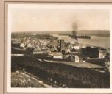
Bild 4. Bingen, Rhein