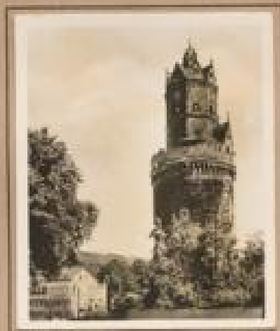
Bild 16. Burg Hahnbühl Die Burg Hahnbühl, einig- zig bei Grafen von Hohenlohe, von 1894 bis 1900.