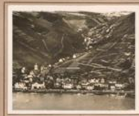
Bild 7. Wiesbaden, Rhein

Die Germania (1880), gemauert bei Wehrturm, ist ein Wahrzeichen der Stadt, ist ein Wahrzeichen der Stadt.