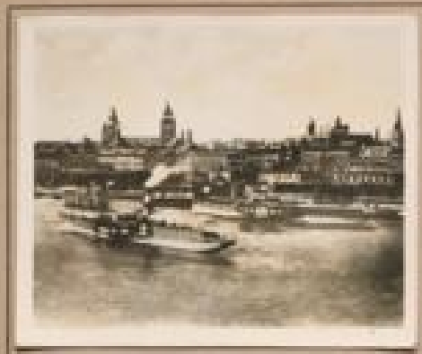
Bild 1. Mainz, Rheinstädtel

Die alte Städtelicht, mit romanischem Kern, ist charakteristischer Wehrbau und ein wichtiger Rheinstädtelort.