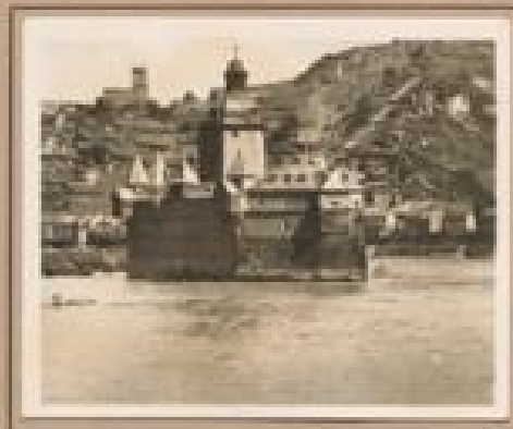
Bild 8. Die Burg bei Bingen

Belvedere Weinhof (Weinhof), auch ein Wahrzeichen der Stadt, ist ein Wahrzeichen der Stadt.