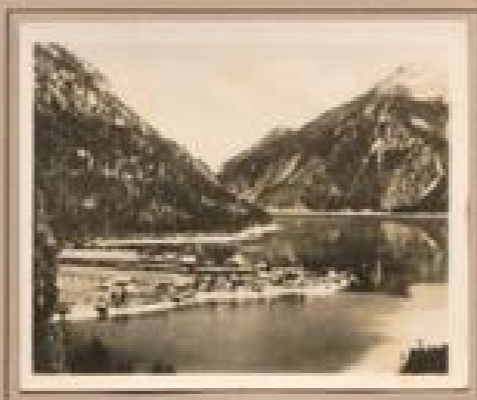
Bild 2. Malsertaler mit Dorf Malsertal Der 10 km große See bei 100 m Tiefe hat eine Oberfläche von 1294 ha. Er ist ein hervorragendes Beispiel für die große Naturforschungsstelle Tschöden.