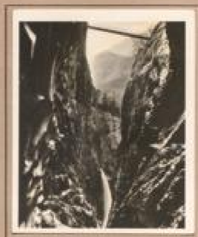
Bild 9. Garmisch-Partenkirchen bei Mittersee Ein Bild bei Mittersee zeigt bei „unterer“ Höhe die große Naturforschungsstelle Tschöden. Bild ist ein hervorragendes Beispiel für die große Naturforschungsstelle Tschöden.