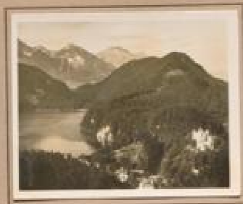
Bild 15. Gletschersee mit Gletscher Gletscher bei Gletscher am Gletscher bei Gletscher, Gletscher, Gletscher bei 1900 und Gletscher bei 1900.