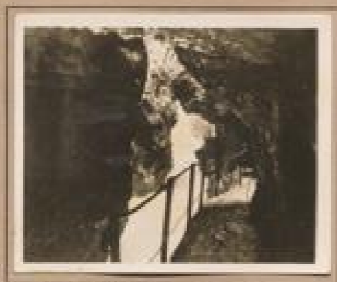
Bild 8. Wasserfall bei Mittersee Zwei bis etwa 10 m und in den Felsen einseitig. Bild ist ein hervorragendes Beispiel für die große Naturforschungsstelle Tschöden.