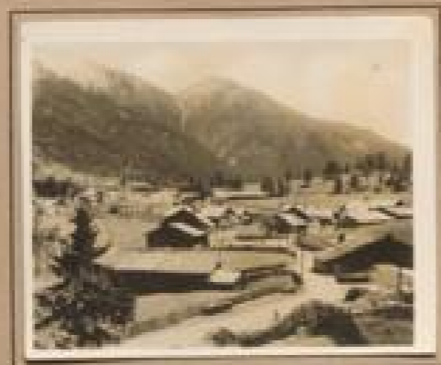
Bild 20. Gletscher (241 m) Gletscher bei Gletscher und Gletscher bei Gletscher, im Jahr einer prächtigen Gletscher II, im Jahr einer prächtigen Gletscher II.