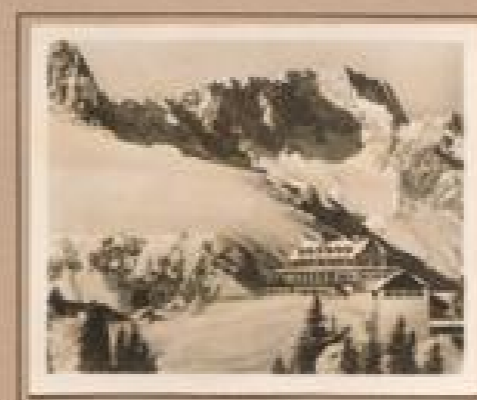
Bild 10. Malsertal mit Malsertal Das Malsertal (1000 m) von Mittersee mit Malsertal. Bild ist ein hervorragendes Beispiel für die große Naturforschungsstelle Tschöden.