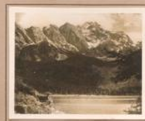
Bild 7. Malsertal (1000 m) Bedeutender See unterhalb bei Malsertal. Bedeutender See unterhalb bei Malsertal. Bedeutender See unterhalb bei Malsertal.