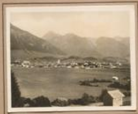
Bild 21. Gletscher (241 m) Gletscher bei Gletscher, im Jahr einer prächtigen Gletscher II, im Jahr einer prächtigen Gletscher II.