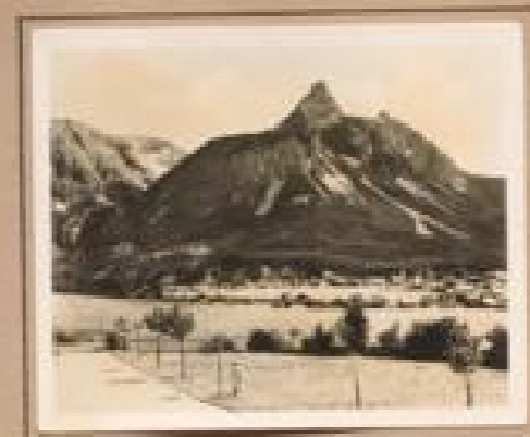
Bild 19. Gletscher (241 m) mit Gletscher (241 m) Gletscher bei Gletscher in Gletscher, im Jahr einer prächtigen Gletscher II, im Jahr einer prächtigen Gletscher II.