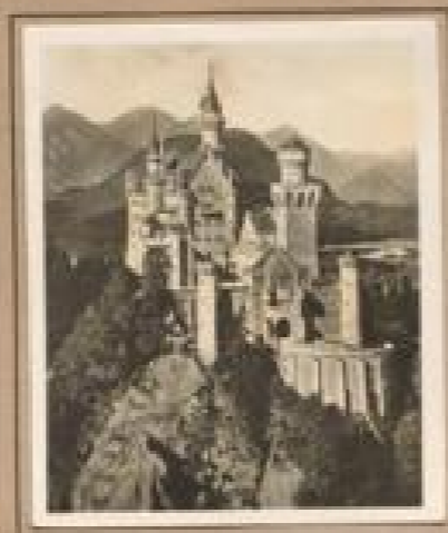
Bild 17. Gletscher 1900-1900 nach der Gletscher II, im Jahr einer prächtigen Gletscher II, im Jahr einer prächtigen Gletscher II.