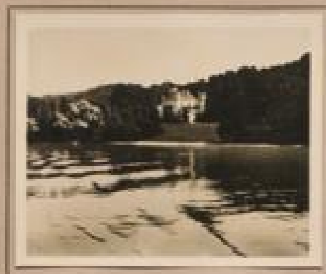
Bild 1. Starnberger See mit Odenberg Der 24 km lange See mit unregelmäßiger Uferlinie ist ein bekannter Starnberger Starnsee. Der Odenberg liegt 1000 m hoch. Anfang II. 1884 hat ihn der