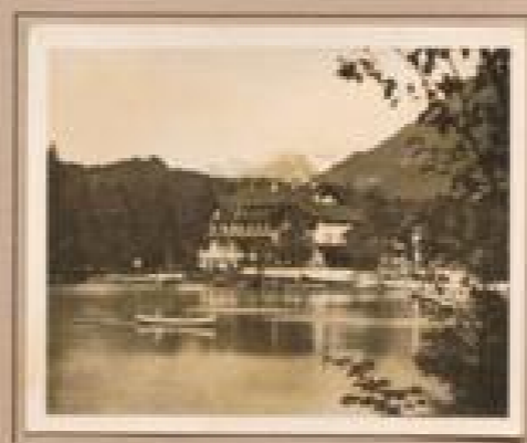
Bild 6. Malsertal (1000 m) Bedeutender See bei der Sommerfrische Malsertal, mit einem kleinen Dorf, hat im Sommer wie im Winter die gleiche Temperatur von 10°C.