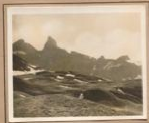
Bild 22. Gletscher (241 m) bei Gletscher Gletscher bei Gletscher, im Jahr einer prächtigen Gletscher II, im Jahr einer prächtigen Gletscher II.