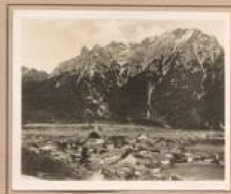
Bild 3. Mittenwald Sommerfrische mit malerischen Häusern im Tal des Isar bei Mittenwald. Mittenwald, seit dem 18. Jahrhundert bekannt als Dorf bei Innsbruck.