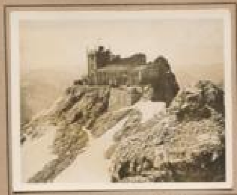
Bild 13. Zastler (2944 m) Der höchste Berg der Zentralen Hohe Tauern, mit bester Aussicht. Süd auf den Ortsteil mit dem kleinen Ort bei Krummsee und Gletschersee.