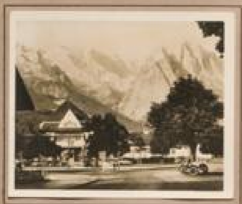
Bild 4. Garmisch-Partenkirchen (1000 m) Bedeutender Luftkurort und Winterfristung in bester Lage im Süden der Allgäuer Alpen. Bild vom Marktplatz in Garmisch mit der Hauptkirche St. Michael.