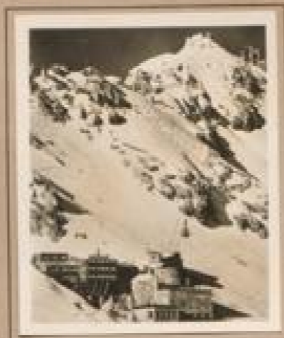
Bild 14. Edelweissberg (2600 m) mit Berggasthof Kühnster Bergbau am Jagdschloß, Edelweissberg bei 1900 erbaute Edelweissberg-Gasthof. Das hier führt eine Seilbahn weiter zum Gipfel.