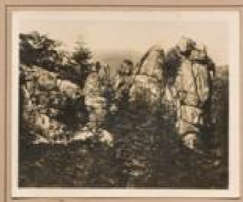
Bild 10. Die Wasserfälle in Cappel

Der herrlichste Kurort bei Gengenbach, an der Elbung bei Hohenaltdorf gelegen, ist durch den herrlichen Kurort.