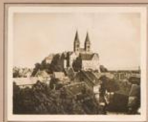
Bild 3. Castellburg, Blick von Quedlinburg

Der Hauptort des römischen Goldfelds im Harz, im 12. Jahrhundert gegründete Dingy mit dem höchsten Turm auf dem 18. Jahrhundert.