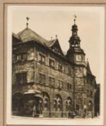
Bild 14. Gengenbach, Kurort (1899-1900)

Die herrliche Kurort am Markt der Gengenbach bei Gengenbach, ist ein herrlicher Naturort.