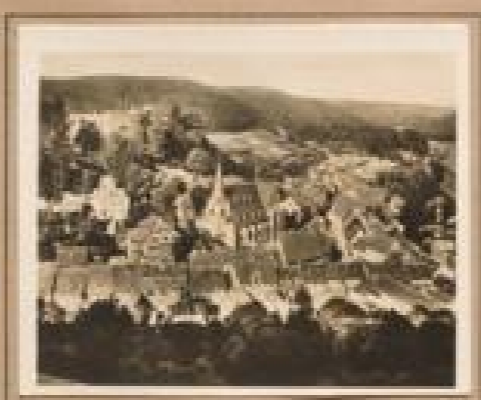
Bild 15. Gengenbach, Kurort

Der herrlichste Kurort bei Gengenbach, wo der Gengenbach auf die Gengenbach Kurort im 17. und 18. Jahrhundert.