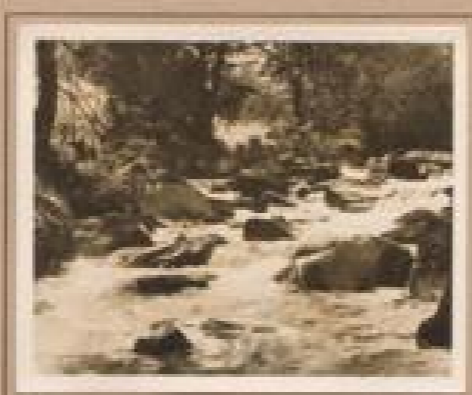
Bild 7. Das Elbe bei Quedlinburg

Blick von Quedlinburg auf die Bergkirche (12. bis 13. Jahrhundert) im Harz, im 18. Jahrhundert erbaut, im 1881 bis 1882 erbaut, im 1881 bis 1882 erbaut.