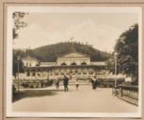
Bild 9. Gengenbach, Kurort

Lang eingetieft im Tal der Schwarzen Wälder liegt bei dem Waldort und schönem Sommer-Ortsort.