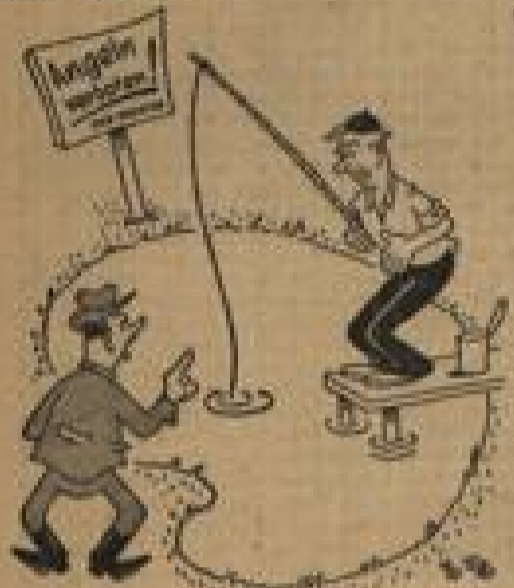
„Sie haben einen Fisch vor meinem Teich gezeichnet und ihn totgeschlagen.“