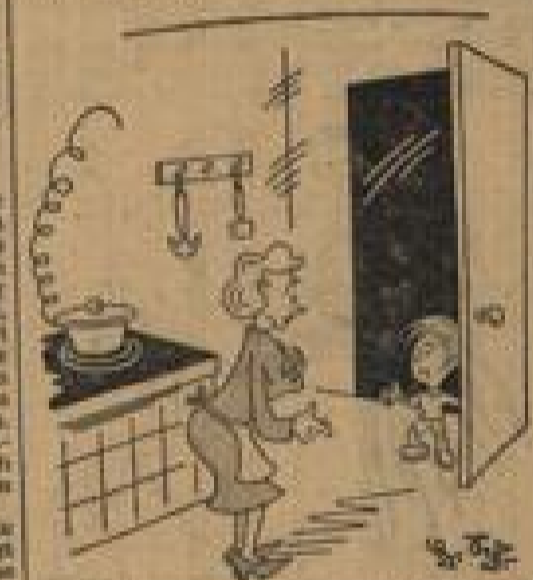
„Mutter, wenn jemand nach mir fragt — ich bin krank.“