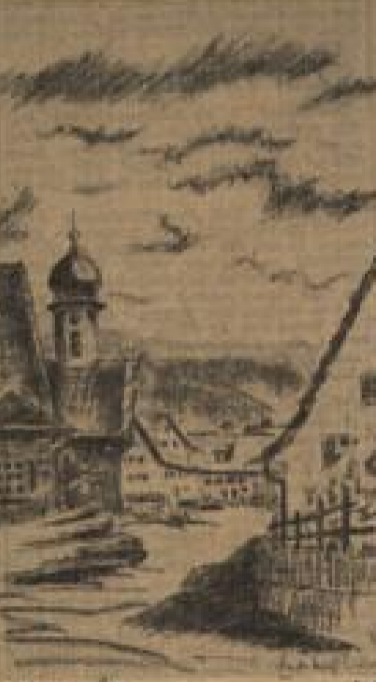
Berndt bei Herrensath