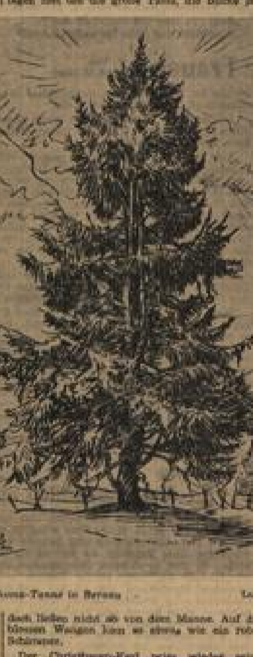
Mani-Thoma-Tanz in Bremen

„Aber nicht so von dem Manne. Auf die kleinen Wagen kann es stress wie ein roter Schimmel.“