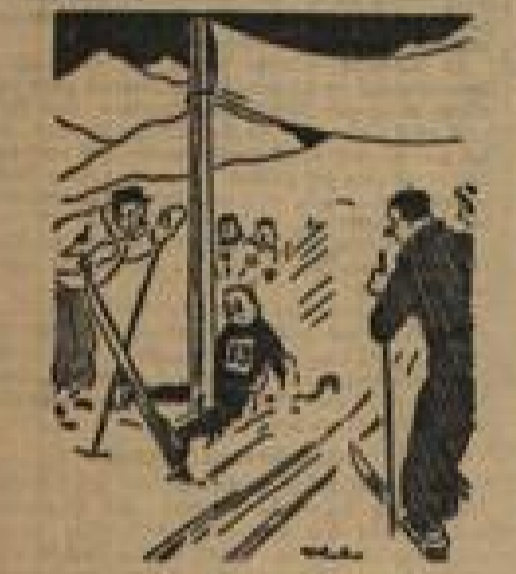
Der Prozeß als Ziel