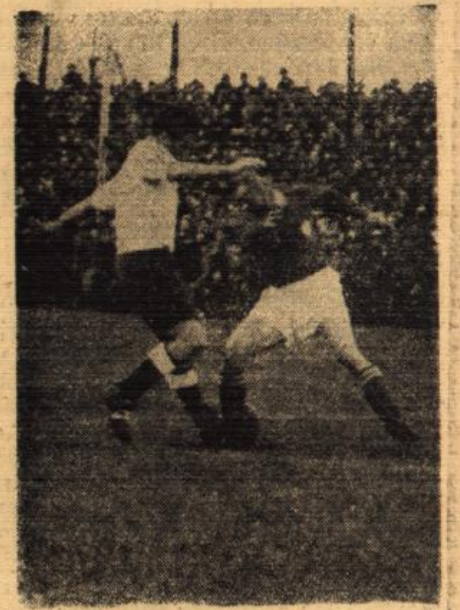
Der frühere Waldhöfer trat auch im Fürther Trikot gegen den „Erbfeind“ VfR an. Hier sehen wir ihn im Kampf mit De la Vigne.

Die Gäste legten denn auch nach der Pause gleich mächtig los und bereits nach fünf Minuten hatten sie den Ausgleich erzwungen. Im Anschluß an einen Eckball konnte Hölzer plaziert einschließen. Aber nun wurde Waldhofs Abwehr im Drang nach dem Siegestor unvorsichtig und die Münchener konnten durch zwei weitere Tore innerhalb fünf Minuten dem Spiel die entscheidende Wendung geben.