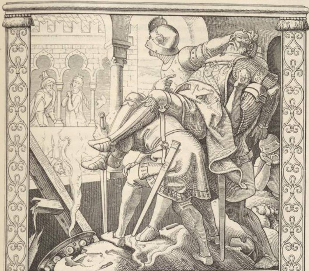
Wie Rüdiger erlagen wart.

Nicht lang mehr, mein' ich, will uns Gott das Leben lassen". . . Verrauschet war das Toben und die müden Männer saßen oder lehnten ruhend umher. Der lauschenden Königin aber machte die Stille bang und sie sagte zu dem König: „Weh mir dieses Kummers! Allzu lange