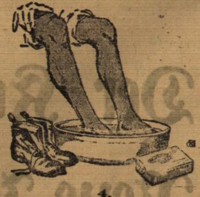
Adolar, der Unbeweibte. (Untere Partie.)