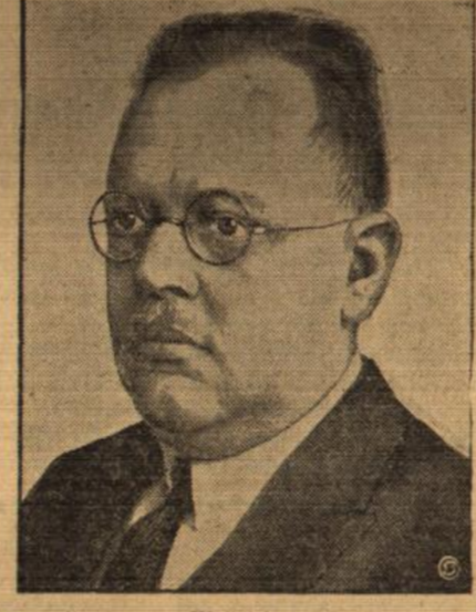
Hermann Müller-Franken, der vom Reichspräsidenten mit der Regierungsbildung beauftragt worden ist.

Vor Mittwoch abend dürfte die Frage der Kabinettsbildung also um keinen Schritt weiter gekommen sein. Bis die deutsche Volkspartei nicht gesprochen hat, ist nichts zu erwarten. So sehr sich auch die glühenden Verehrer der Großen Koalition in ihrer Presse Mühe geben werden, immer wieder von vollendeten Tatsachen zu sprechen. Gewiß steht die Deutsche Volkspartei am Mittwoch vor grundsätzlichen und bedeutungsvollen Entscheidungen und es genügt, hier nur wenige Dinge herauszuheben, um die Schwierigkeiten zu zeigen, die noch immer vor dem verschlossenen Tor der Großen Koalition stehen. Der Kanzlerkandidat Müller-Franken hat am Montag bei seiner Unterredung mit dem Reichsweheminister Dr. Grüner die Frage eines Staatssekretärs für das Reichsweheministerium angeschnitten. Man weiß, daß der Minister selbst keineswegs ein Freund dieser Neuerung ist. Auch die Deutsche Volkspartei kann das Odium der Postfittierung der Reichswehr, die ja doch der Staatssekretär bedeutet, nicht auf sich nehmen. Auch in Wirtschaftfragen, ferner in der Frage des Schulgesetzes und der Reichsreform wird von der Deutschen Volkspartei eine klare Stellung gefordert, die sie ihren Verhandlungsgegnern vorlegen muß. Für den Fall, daß sich hier eine gemeinsame Grundlage finden läßt, ist allerdings zu erwarten, daß dann die Bildung des Kabinetts sehr schnell vor sich gehe.