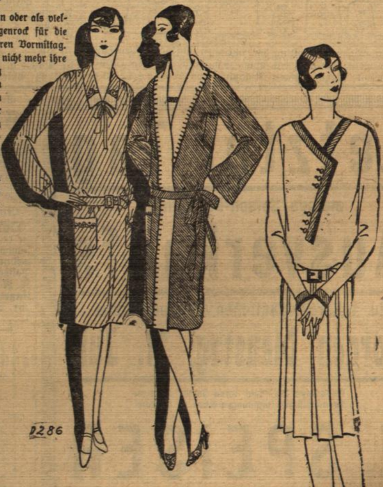
T 0286 Morgenkleid aus Baumwollmarocain. Einfache Mittelform mit aufgesetzten Taschen, die, wie der Kragen mit weißen Blenden und einer hübschen Stiderei ausgefattet sind. Schnallengürtel. Applikationsmuster, Preis 20 Pf. Lyon-Schnitt, Größe 42, 44, 46 und 48, Preis 95 Pf.