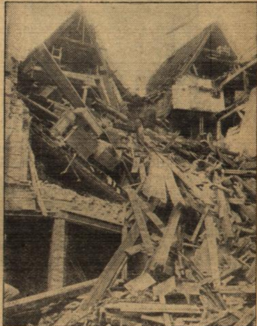
Häusereinsturz in Stralsund.

Kürzlich stürzte in Stralsund ein Doppelhaus ein. Das Unglück geschah durch den Ausbau eines Ladens, der sich in dem einen der Häuser befand. — Unser Bild zeigt die Trümmerstätte.