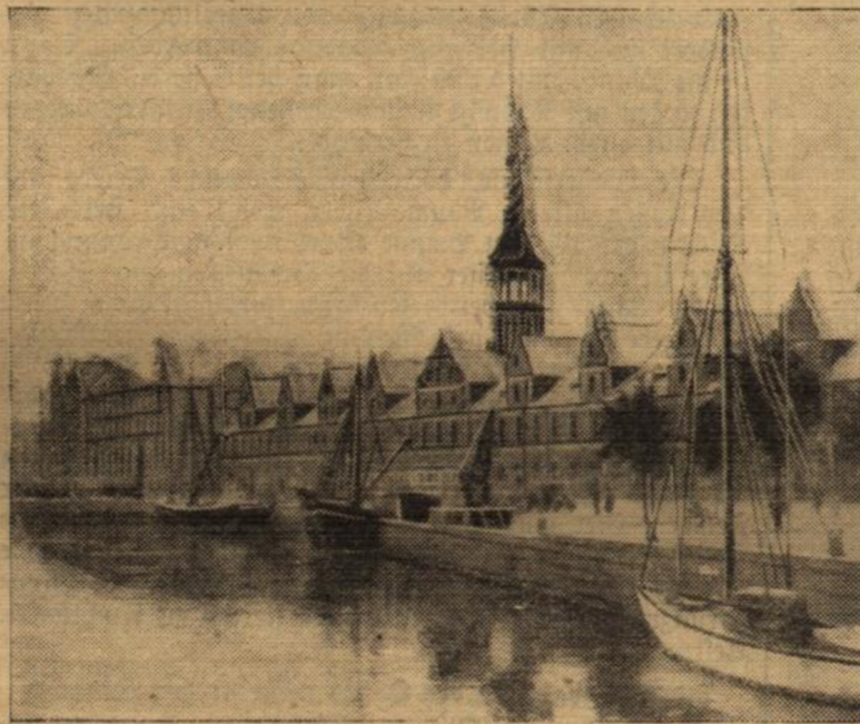
Zum Banktrach in Kopenhagen.

Die in den letzten Tagen vielgenannte größte dänische Bank „Privatbanken“ mußte infolge Verlustes von etwa 70 Millionen Dänekronen ihre Zahlungen einstellen. Die erste Auswirkung war der Rücktritt des dänischen Handelsministers. — Die Börse mit dem berühmten Krotodilturm und hinten anschließend das Hauptgebäude der verkrachten „Privatbanken“.