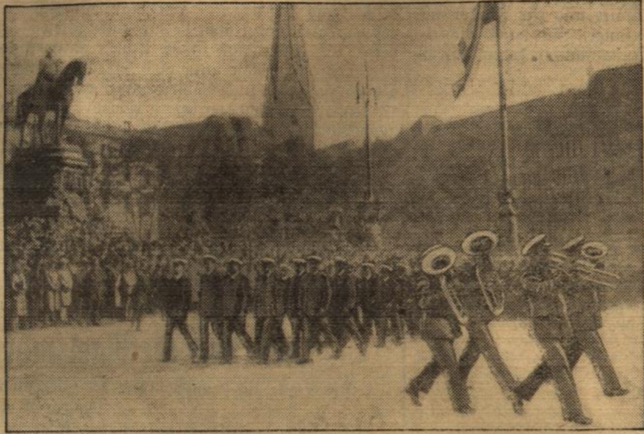
Chilenische Gäste in Hamburg.