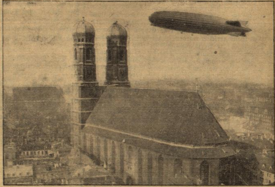
„Graf Zeppelin“ über München.

Gelegentlich seiner Süddeutschlandfahrt berührte das neue Luftschiff „Graf Zeppelin“ auch die bayerische Hauptstadt. — „Graf Zeppelin“ überfliegt die Türme der Frauentirche in München.