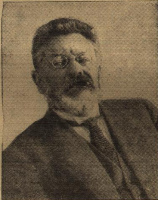
Max Slevogt 60 Jahre alt.

Am 8. Oktober begeht der berühmte deutsche Maler Max Slevogt, gebürtig aus Landslut, seinen 60. Geburtstag.