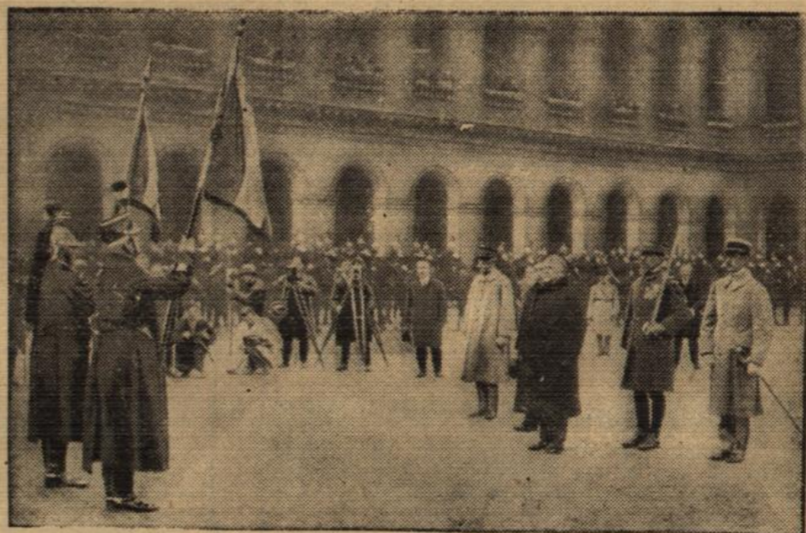
Doumergue, Ritter der Ehrenlegion.

Dem französischen Präsidenten Doumergue wurde unter dem üblichen militärischen Gepränge das Kreuz der Ehrenlegion verliehen. Hauptache, der Akt wird gefilmt!