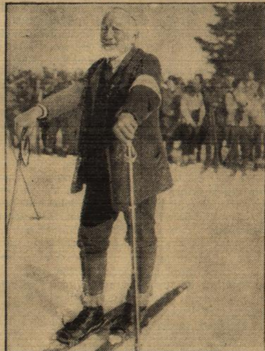
Der Senior des deutschen Skisports.