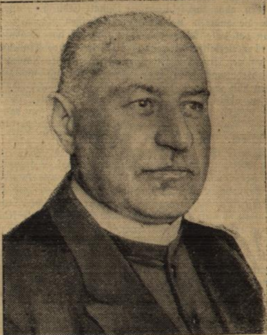
Der Führer der Bayerischen Volkspartei 60 Jahre alt.