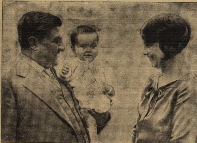
Der neue Präsident von Mexiko.

Nach der Ermordung des ursprünglich gewählten Präsidenten Obregon wurde der bisherige Innenminister Portes Gil zum Präsidenten von Mexiko gewählt. — Portes Gil mit Frau und Kind.