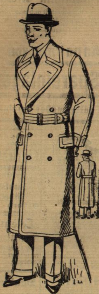
Dieser elegante Ulster in eigener Werkstätte gear- beitet kostet nur 48.-