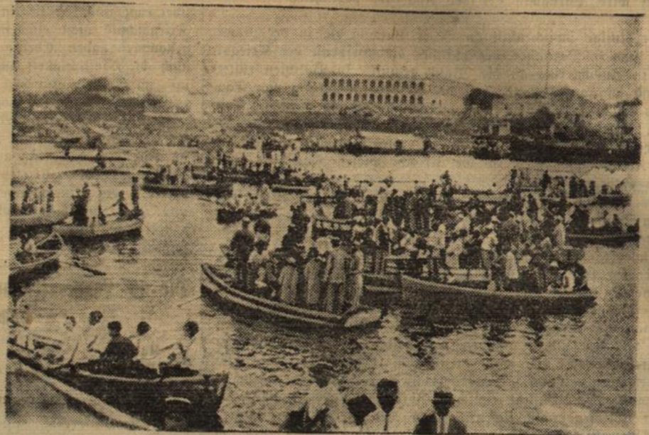
Kriegsgefahr in Südamerika.

Zwischen Bolivien und Paraguay sind offene Feindseligkeiten ausgebrochen, die bereits zu Kämpfen an der Grenze geführt haben. — Blick auf die bolivianische Hauptstadt La Paz.