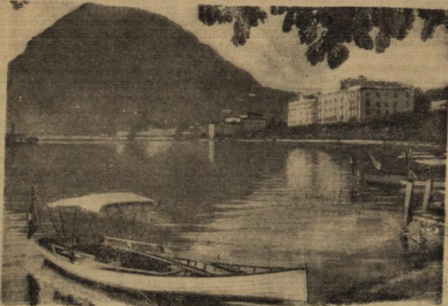
Hier läßt sich's gut beraten.

In dieser herrlichen Umgebung, unmittelbar an den Ufern des Kurhauses, finden die Verhandlungen des Bülterbundes statt. Im Hintergrunde das Kurhaus.