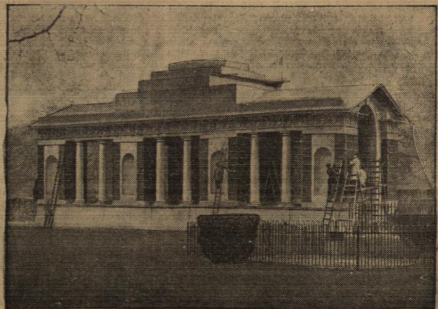
Ein Marine-Ehrenmal im Londoner Tower.

Für die Gefallenen der englischen Handelsmarine ist im Hofe des Tower in London ein Ehrenmal errichtet worden, das in diesen Tagen eingeweiht wurde. — Die letzten Arbeiten an den Bronzetafeln, auf denen die Namen der Gefallenen verzeichnet sind.