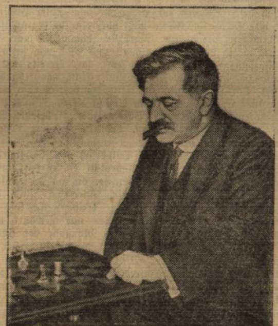
Der Meister des Schachspiels 60 Jahre alt.

Dr. Emanuel Lasker, der weltbekannte deutsche Schachmeister, feiert am 24. Dezember seinen 60. Geburtstag. — Letzte Aufnahme Laskers am Schachbrett.