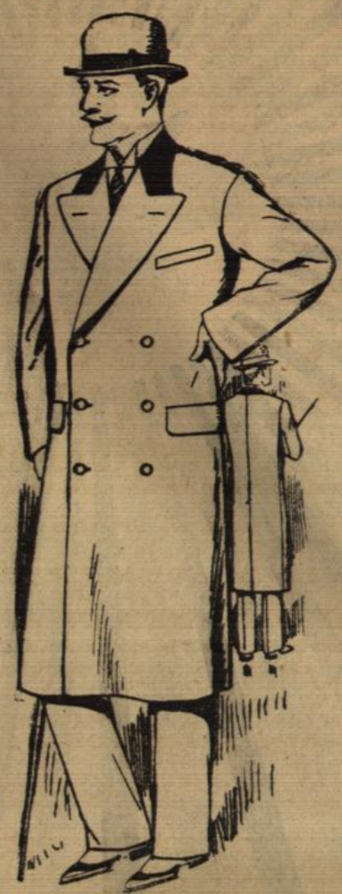
Dieser moderne Paletot mit Samtkragen, aus gutem Melton-Stoff kostet nur 55.-

Elegante Rauchjacken in guten Flausch-Qualitäten ..... 28.-, 19.50, 15.-