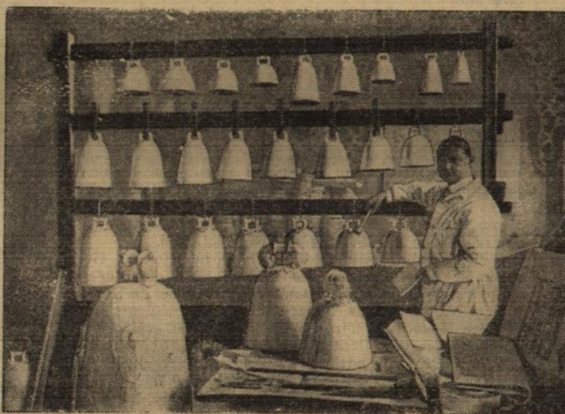
Ein Glockenspiel aus Porzellan.

Zur Tausendjahrfeier der Stadt Meissen im nächsten Jahre wird in der staatlichen Porzellanmanufaktur zu Meissen ein Glockenspiel hergestellt, das aus 46 abgestimmten Glocken besteht. Das Glockenspiel ist für den Meissener Stadtturm bestimmt. — Beim Abstimmen der bereits hergestellten Glocken.