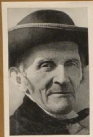
Alter Bauer aus dem badischen Schwarzwald