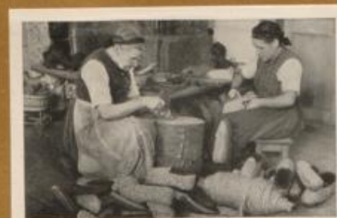
Strohschuhmacherinnen aus dem Elstal in Baden