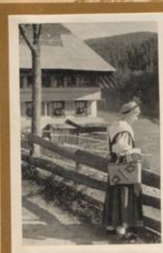
Schwarzwaldbäuerin vor ihrem Hause