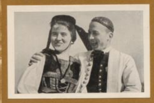
Schwäbische Tracht aus der Gegend von Reutlingen in Württemberg