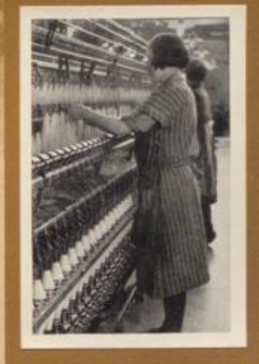
Arbeiterinnen in einem Spinneretwerk