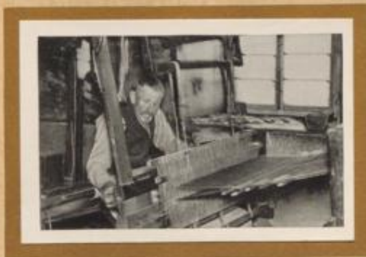
Handweber aus dem Schwarzwald