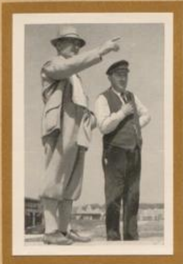
Architekt und Bauleiter