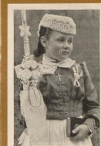
Erstkommunikantin aus Simonswald in Baden