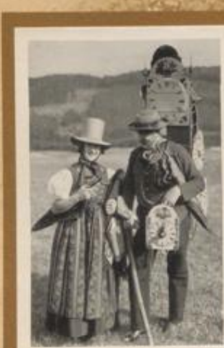
Wandernde Uhrenhändler im Schwarzwald