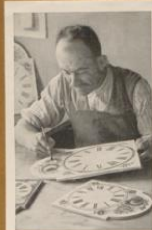
Uhrenschilddmaler aus Eimbach i. Schwarzw.