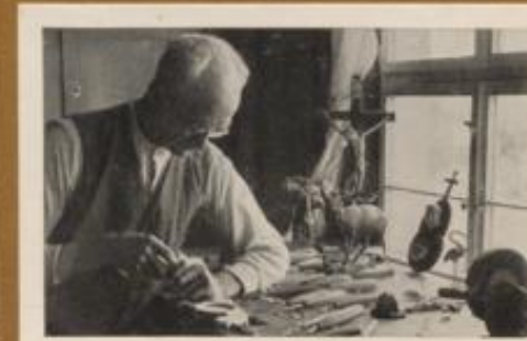
Holzschnitzer aus Bernau bei der Arbeit