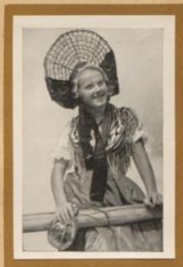
Junges Mädchen aus der Gegend am Bodensee in Überlinger Tracht