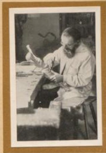
Herrgottschneider aus Oberammergau