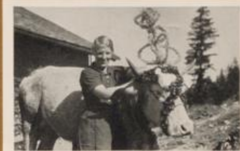
Sennerin mit ihrer Lieblingskuh auf der Alm vor dem Abtrieb ins Tal