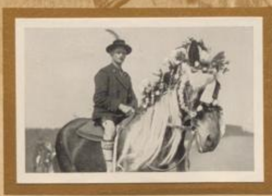
Alterreiter von Traunstein