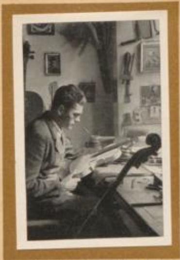
Geigenbauer aus Mittenwald