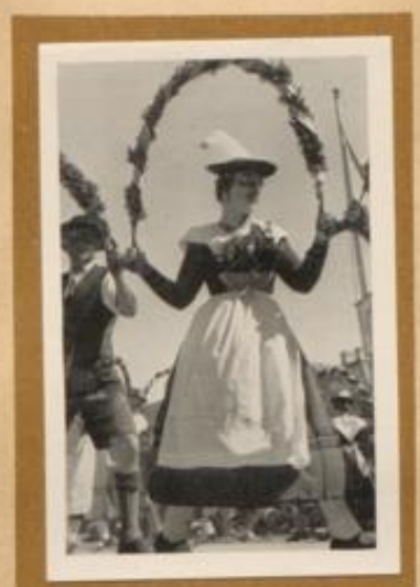
Volkstanz in Oberbayern