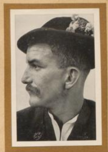
Ein Mann aus Kochel