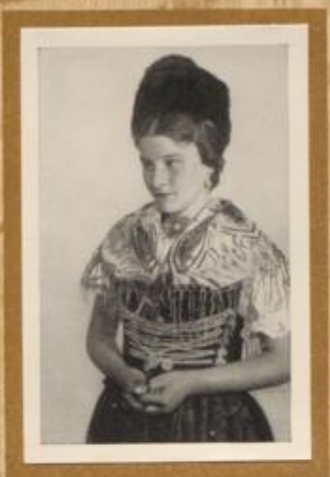
Mädchen in alter Dieffener Tracht