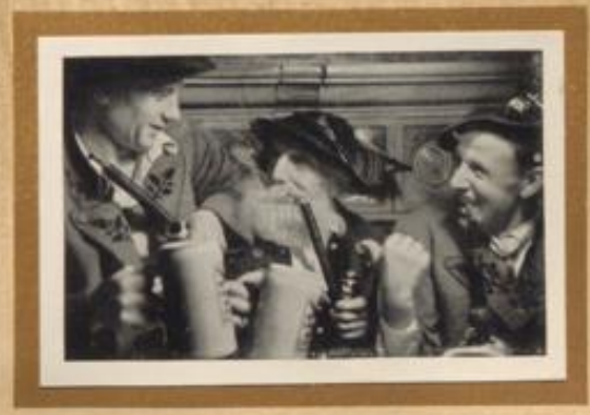
Ein alter und zwei junge oberbayerische Bauern beim gemütlichen Trunk