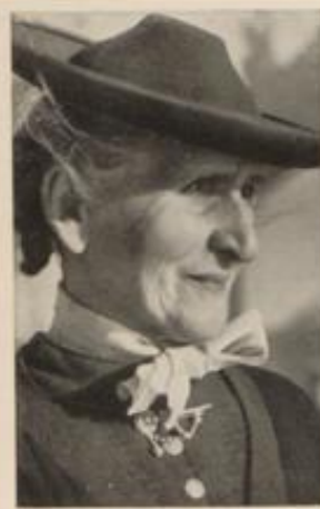
Mäuerin aus Tegernsee