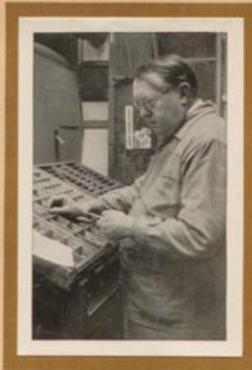
Buchdrucker am Setzstein