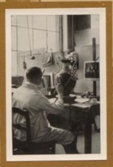
Malen der Reihner Porzellanmanufaktur beim Bemalen einer Vase