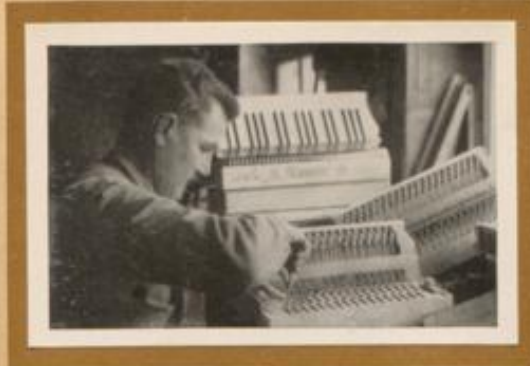
Altordoenmacher aus Klingenthal im Erzgebirge