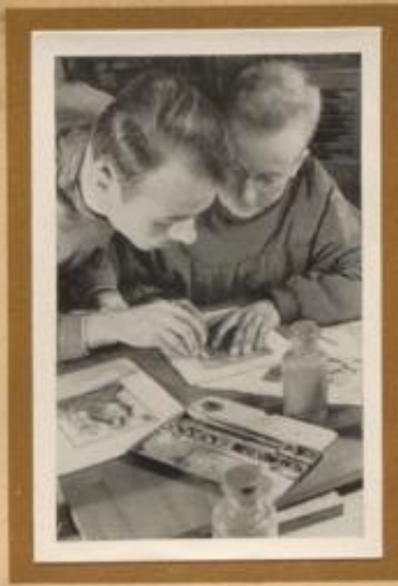
Kolorieren von Handpressendruck