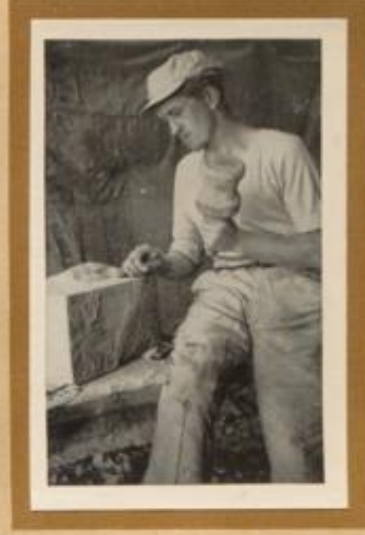
Steinmetzgefelle bearbeitet einen Stein