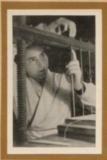
Buchbinderin an der Heftlade