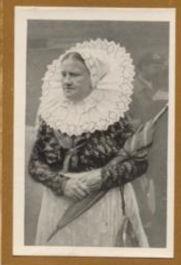
Alte deutsche Tracht der südlichen Oberlausitz