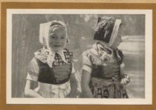
Kinder in wendisch-protestantischer Festtracht aus der Oberlausitz