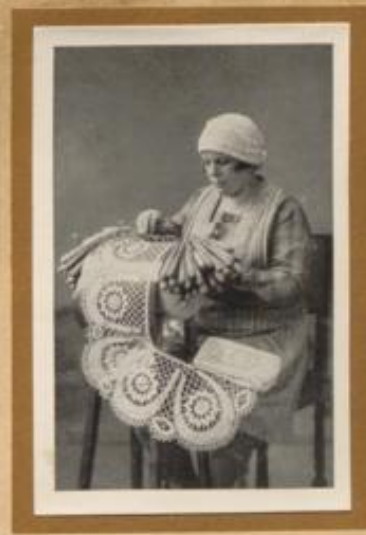
Spitzenküpplerin aus Steinbach im Erzgebirge