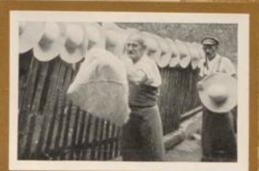
Trocknen frischer Hüte einer Hutmacherei im Erzgebirge