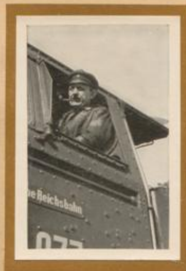
Locomotivführer der Reichsbahn