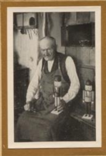
Ein alter Nuthackerlehrling aus dem Erzgebirge