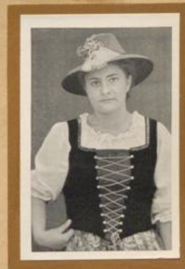
Zillertalerin aus dem Riesengebirge, Nachkomme von Tiroler Einwanderern zur Zeit Friedrichs des Großen