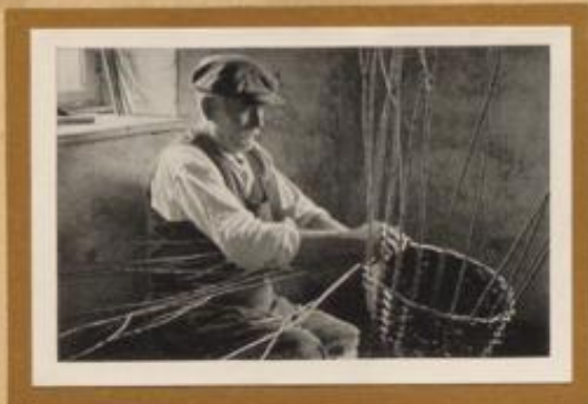
Schlesischer Korbflechtermeister aus der Gegend vom Zobten