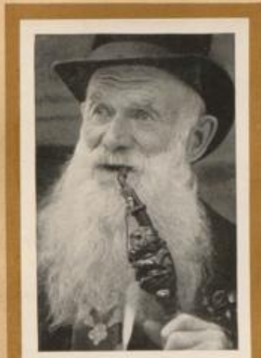
Alter Mann aus dem Riesengebirge, der Räbezabl sein Können