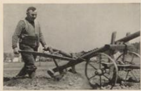
Schlesischer Bauer beim Pflügen