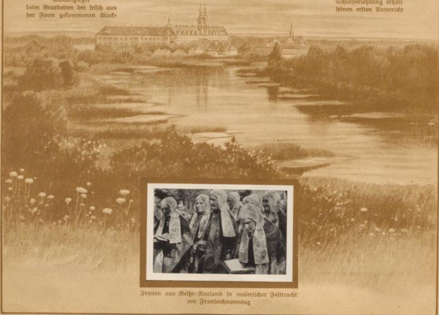
Frauen aus Reife-Neuland in malerischer Festtracht am Fronleichnamstag