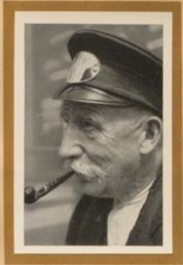
Ein schlesischer Dienstmann