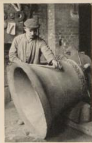
Glodengießer beim Bearbeiten der frisch aus der Form gekommenen Glode