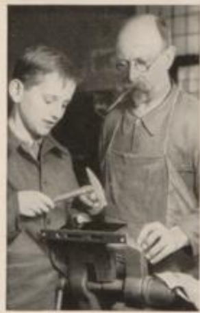
Schlosserlehrling erhält seinen ersten Unterricht