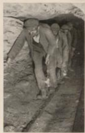
Grubenarbeiter verlassen einen Stollen