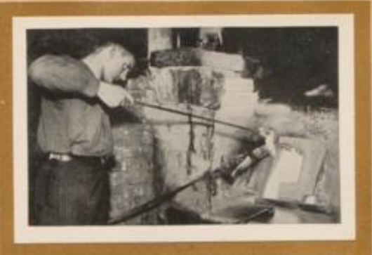
Glasbläser beim Ansetzen des weisglühenden Zuges fertige obere Botelhälfte