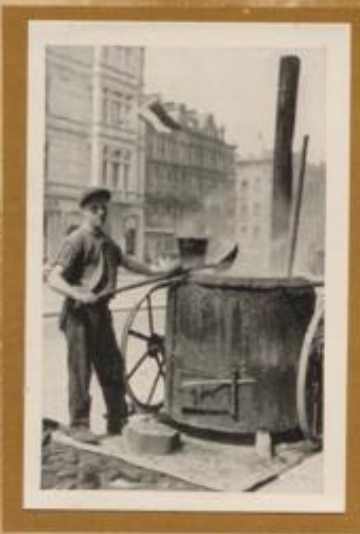
Arbeiter beim Asphaltieren einer Straße