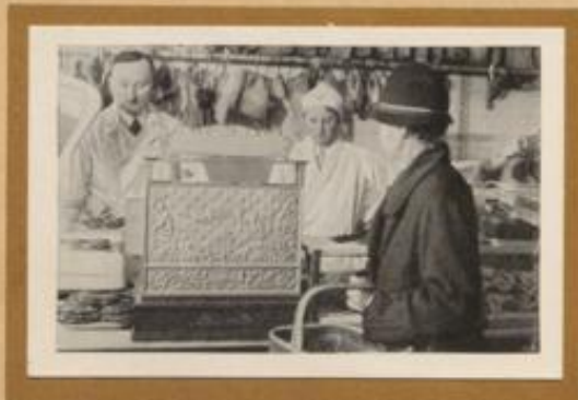
Einkauf im Fleischerladen