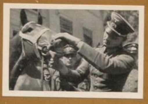
Kavallerieoffizier der Reichswehr