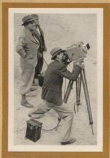
Regisseur und Filmoperator bei einer Szenenaufnahme