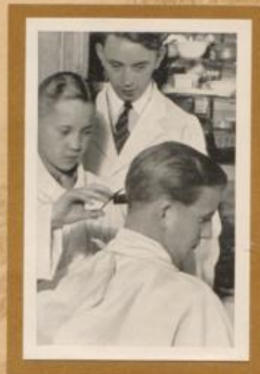
Unterricht beim Haarschneiden