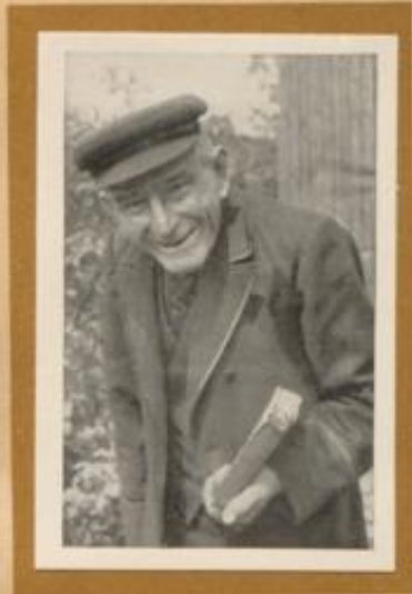
Alter Hüfter aus der Mark