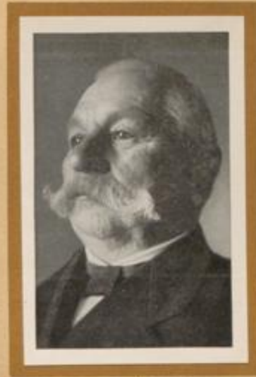
Grenzmärkischer Bauer aus dem Rehekreis