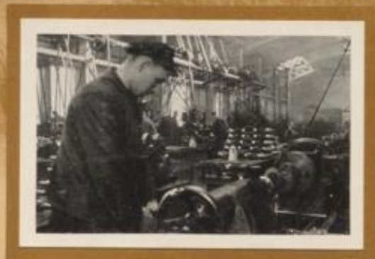
Herstellung von Kurbelwellen in einem Eisenwerk