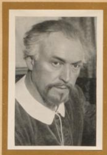
Schauspieler in einer Rolle