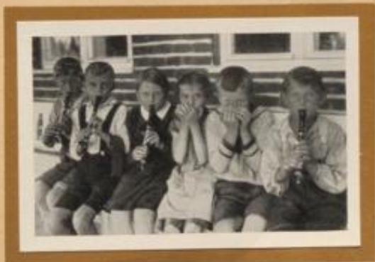
Märkische Kinder machen Musik