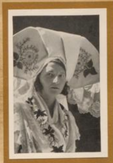
Spreewälderin in schmücker Festtracht