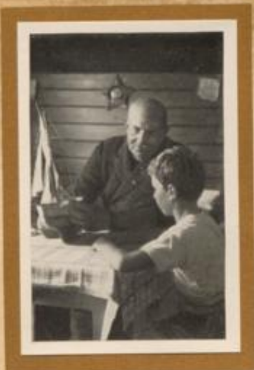
Ein alter Kapitän erzählt seinem Enkel von seinen Seefahrten