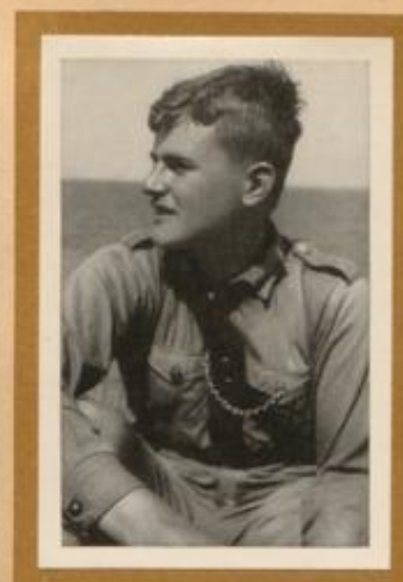
Soldat von der Ostfront