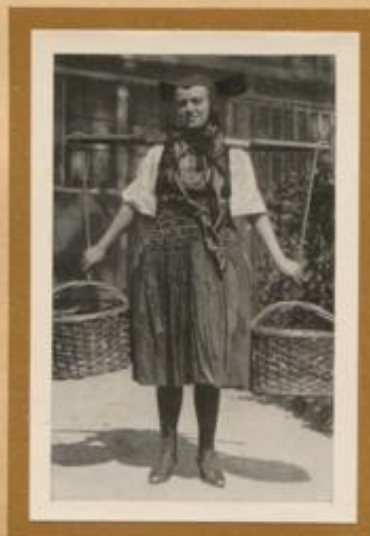
Junge Pomerländerin in ihrer Heimatstracht