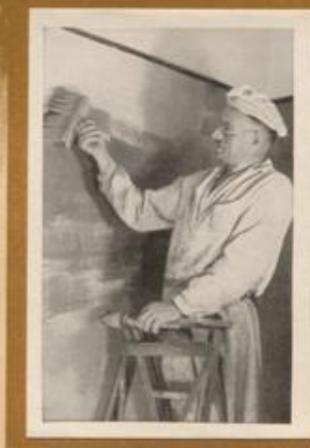
Der Maler bei der Arbeit