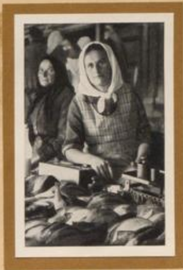
Fischverkäuferin auf dem Fischmarkt