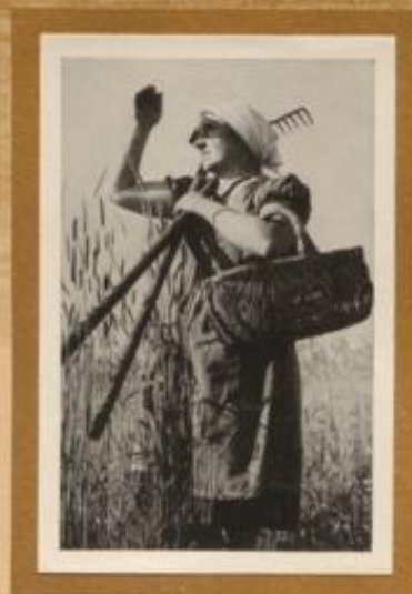
Erntearbeiterin, die, nach dem Wetter Ausschau hält