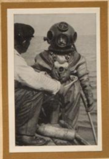
Taucher, der eben eine Granate vom Meeresboden heraufbefördert hat