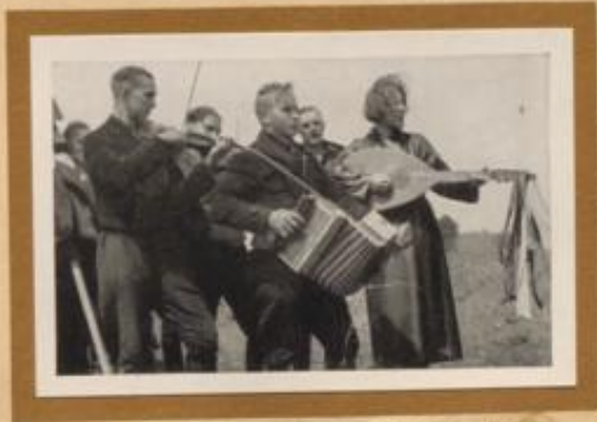
Ausfliegende mecklenburgische Jugend