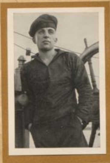
Matrose am Steuer