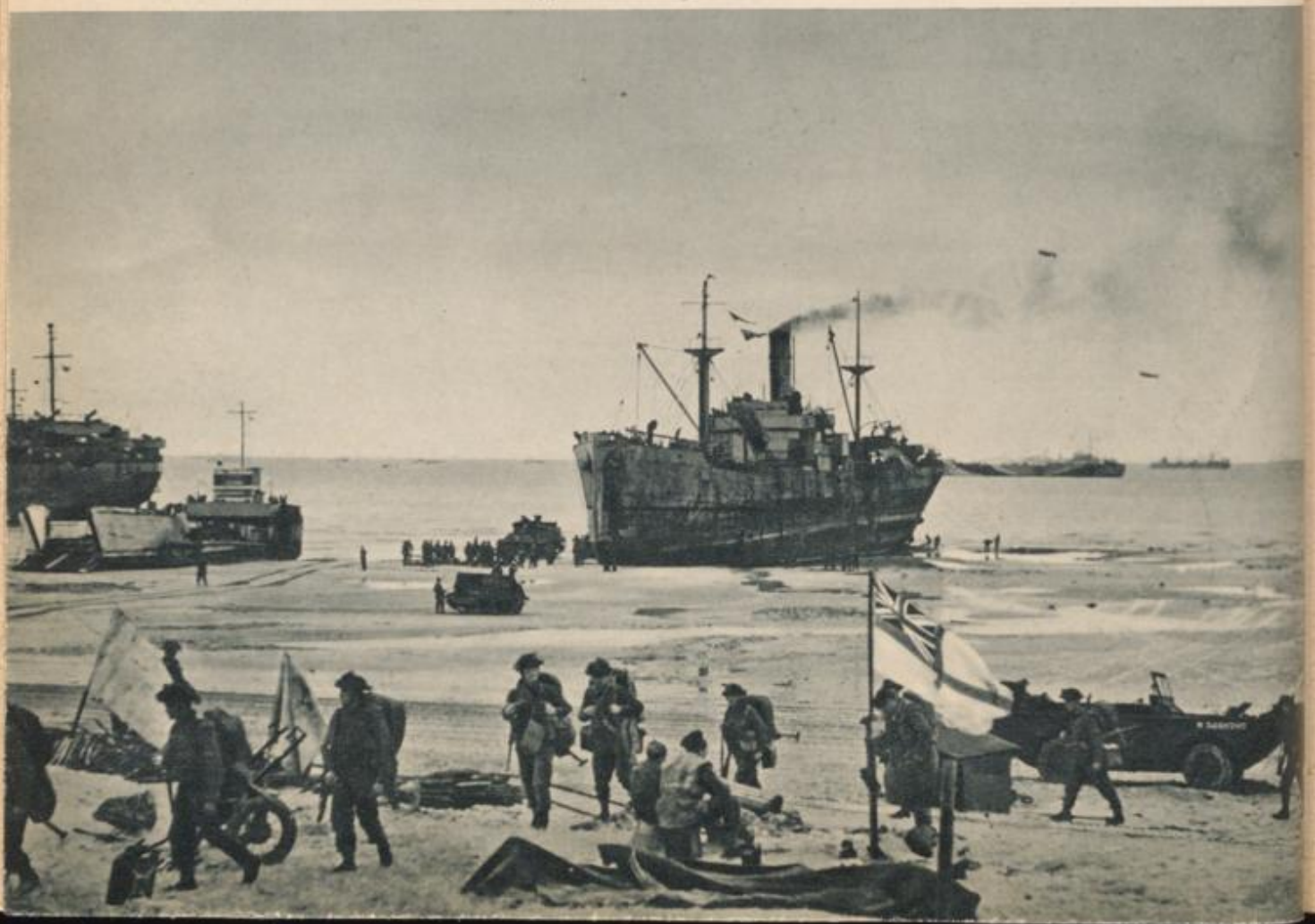
Britischer Transporter beim Ausladen von Truppen und Kriegsmaterial