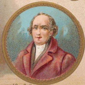
FRANCESCO GIUSEPPE GALL, 1758-1828. Gall espone la sua teoria sulla cranioscopia.