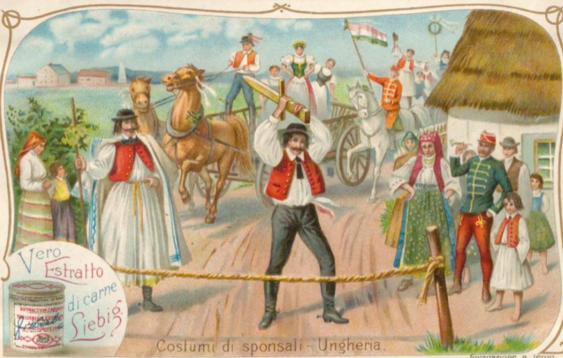
Costumi di sponsali - Ungheria.