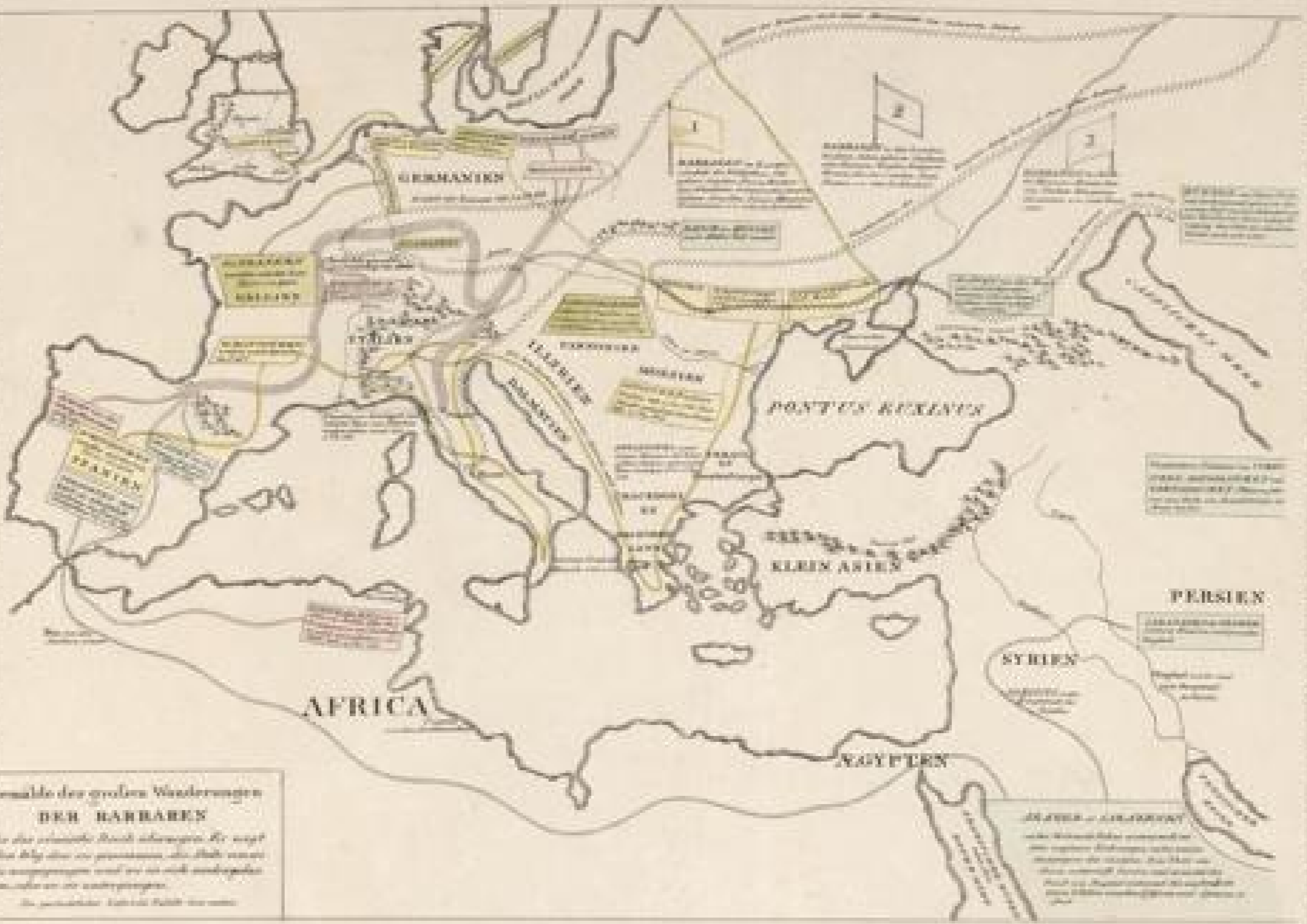
Ursprung der großen Wanderungen DER BARBAREN