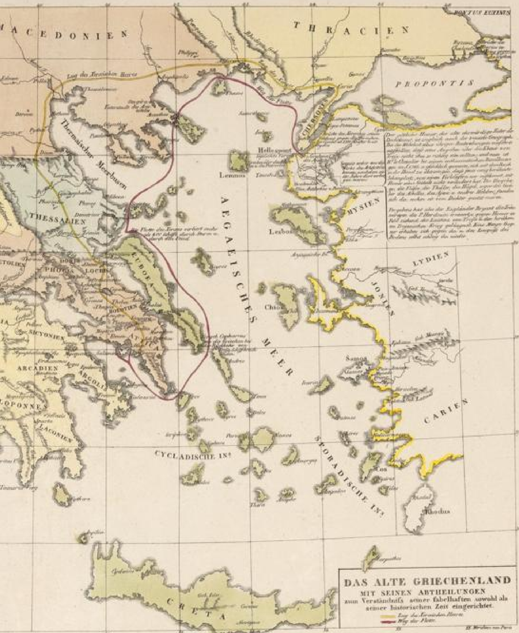
DAS ALTE GRIECHENLAND MIT SEINER ABTHEILUNGEN AUM VERSTÄNDNISS SEINER GEGENWÄRTIGEN SOWIELE ALS SEINER HISTORISCHEN ZEIT EINGERICHTET.