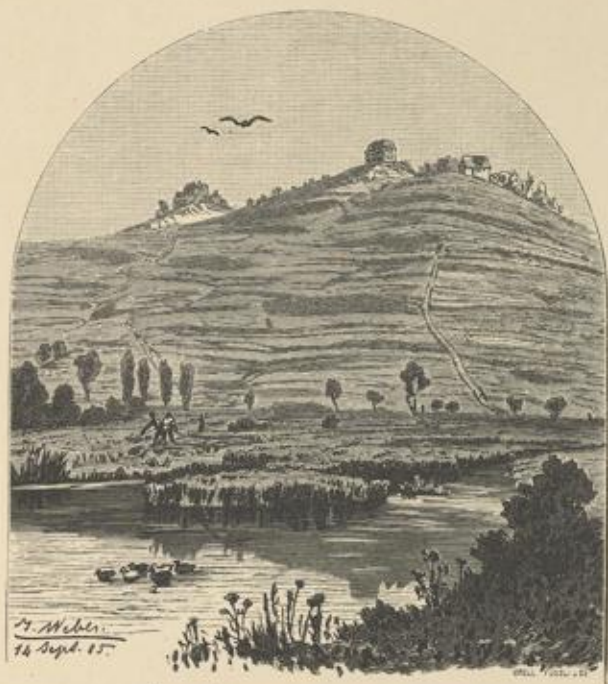
Donauufer am Fusse des Wartemberges.

Unterhalb Gutmadingen überschreitet die Bahn, die bisher dem rechten Ufer folgte, die Donau und wir fahren in die Station Geisingen ein. Geisingen ist ein nettes Städtchen, in dessen Nähe das Gefälle der Donau zur Anlage von verschiedenen Gewerken Gelegenheit gab.