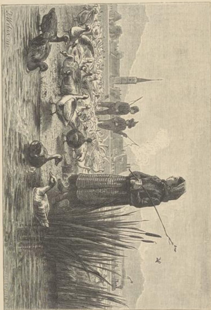
Ottenweide bei Goldingen.