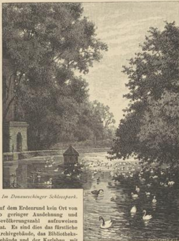
Im Donaueschinger Schlosspark.

auf dem Erdenrund kein Ort von so geringer Ausdehnung und Bevölkerungszahl aufzuweisen hat. Es sind dies das fürstliche Archivgebäude, das Bibliotheksgebäude und der Karlsbau, mit ihren weiterberühmten Sammlungen.