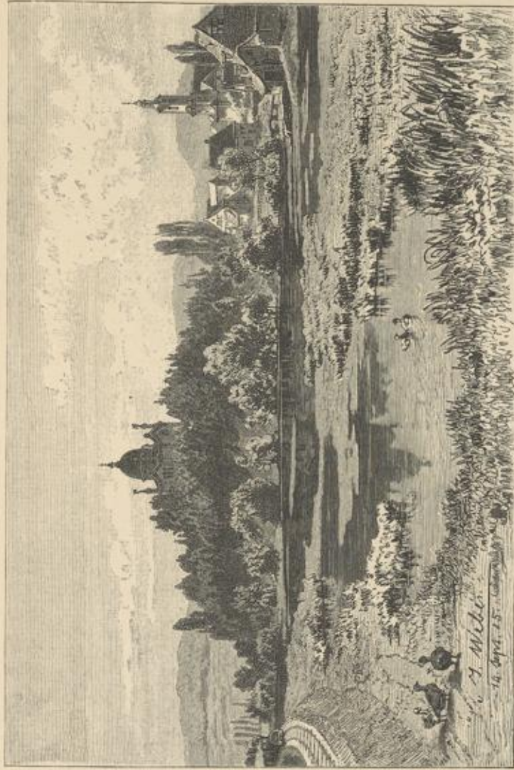
Die Gruthapelle in Neudingen.