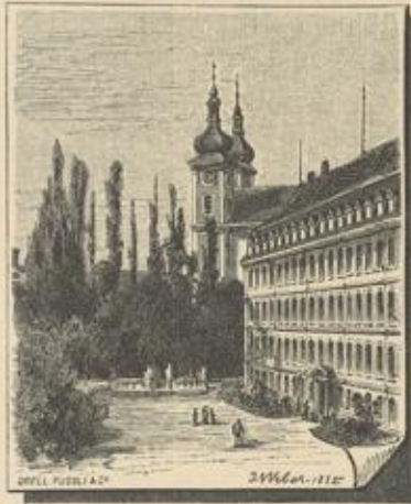
Vor dem fürstl. Fürstenbergischen Schlosse.

Eine Menge von Wasservögeln beleben die letztern, Schaaren von Enten der prächtigsten Arten und vom schönsten Gefieder, weisse und schwarze Schwäne, sowie auch der zierliche Peruaner Schwan, dessen kohlschwarzer Hals so graziös auf dem schneeweissen Leibe sitzt. Ruhebänke, Bildwerke, Schattengänge und hübsche Ausweitungen bieten reiche Abwechslung. In den grossen Gewächshäusern