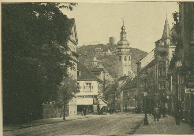
Durlach mit Turmberg (256 m), von dem weitreichende Aussicht.