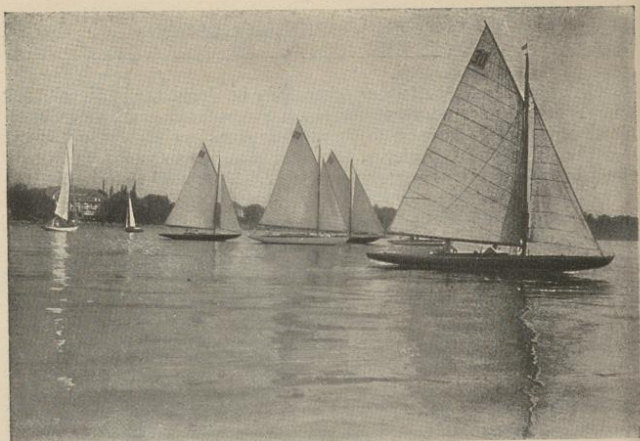
Die Segelyachten vor Friedrichshafen auf der Wettfahrt

angereicht. Als Wanderpreis für Segelregatten haben eine Anzahl Bodenseeuferstädte mit Hilfe des Verkehrsvereins und des Gasthofbesitzerverbandes am Bodensee und Rhein einen kostbaren silbernen Pokal gestiftet, der bis jetzt alle Jahre von einer andern Segelyacht gewonnen wurde. Außerdem sind drei wertvolle Wanderpreise gestiftet: je einen goldenen Pokal der König von Württemberg und der Fürst zu Fürstenberg, während Graf Zeppelin einen kunstvollen, großen Pokal als Preis zur Verfügung stellte. Diese Preise gehen nach zweimaligem Gewinnen dauernd an den Eigentümer der siegreichen Yacht über. So wertvolle Preise fördern den schönen Segelsport auf dem Bodensee am besten.