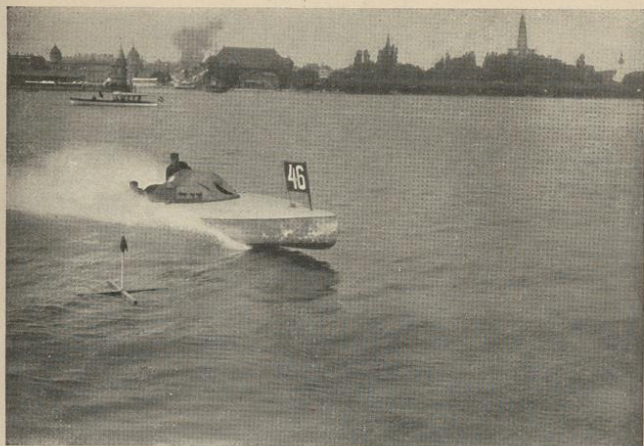
Motorbootwettfahrt in der Konstanzer Bucht

die Preisverteilung. Am 27. Mai findet eine Motorbootwettfahrt (Handicap) nach Lindau statt; ihr schließt sich voraussichtlich ein Höhenwettbewerb für Wasserflugzeuge vor Lindau an. Abends ist Preisverteilung in Lindau.