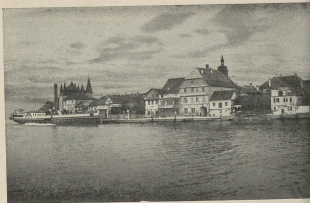
Blick auf Steckborn

Behagliche Unterkunft auch für längeren Aufenthalt findet man im Hotel zur Krone .