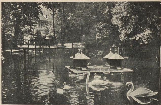
Partie im Stadtpark

Sehenswürdigkeiten: Die im 7. Jahrhundert von hl. Gallus gegründete, 1805 aufgehobene Benediktinerabtei war bis ins 16. Jahrhundert eine der berühmtesten Schulen Europas; im älteren Teile des Klosters die weltberühmte Stiftsbibliothek ; die Stiftskirche , 1756—1766 im italienischen Stil von Geuger erbaut, ist ein trefflicher Bau mit großer Orgel; unter den protestantischen Kirchen die gotische St. Laurenzen- , die St. Leonhard- und die Linsebhühlerkirche ; ferner Helvetia , Bankvereinsgebäude , Toggenburger und Eidgenössische Bank ; das neue Bahnhof- und das neue Postgebäude ; Kantons- und Bürgerspital ; Museum im Stadtpark (reiche alpine und exotische Flora), mit historischen, naturhistorischen und Kunstsammlungen; Heimatmuseum ; Industrie- und Gewerbe-Museum (Mustersammlungen); Waisenhaus , Kantonsschule ; Museum für Völkerkunde im Stadthaus (Gallusstraße Nr. 14); das neue Hadwigschulhaus , die neue Bibliothek Vadiana , das neue Bürgerheim , das neue Tonhalle mit Restaurant; der schöne Monumentalbrunnen , das Vadiandenkmal von Kibling; die großartigen Sitterbrücken usw.