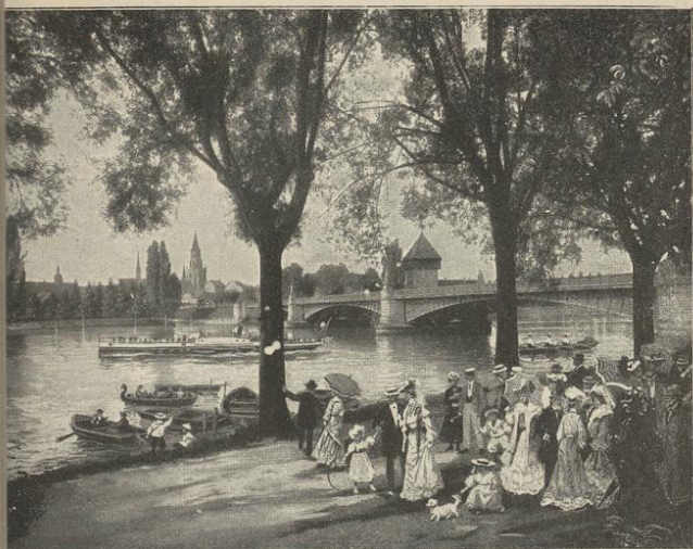
Auf der Seepromenade in Konstanz

Bodensee oder in dessen Nähe weilt? Die alte Konzilstadt mit ihrem eigenartigen Reiz, welchen die alten historischen Gebäude der Nachwelt erhalten, hat auch bemerkenswerte, monumentale Bauten der Neuzeit aufzuweisen. Prächtige, mit allem Komfort ausgestattete und gut geleitete Gasthöfe sind für die höchsten Ansprüche, wie für die einfachsten Lebensbedürfnisse in genügender Auswahl zu finden.