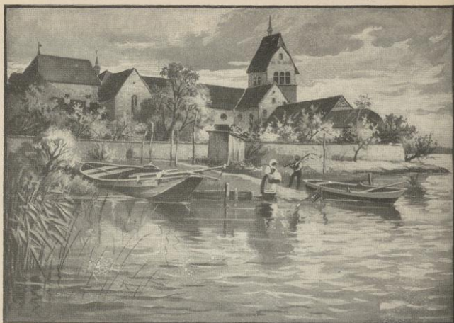
Partie von der Insel Reichenau

ist die schöne Badeanstalt mit ihren stärkenden Seebädern bei konstanter Wasserwärme von 16—22° R. Schöne Spaziergänge, u. a. nach der Mettnau , dem langjährigen Lieblingsaufenthalt des Dichters Scheffel , dem hier auch ein Denkmal errichtet wurde. An den Ufern des Sees schöne Parkanlagen. Ausgezeichnete Verbindungen nach der Schweiz, dem Schwarzwald und an die Ufer des Bodensees und Rheins. — Für gute Unterkunft und Verpflegung empfiehlt sich das Bahnhof-Hotel Schiff .