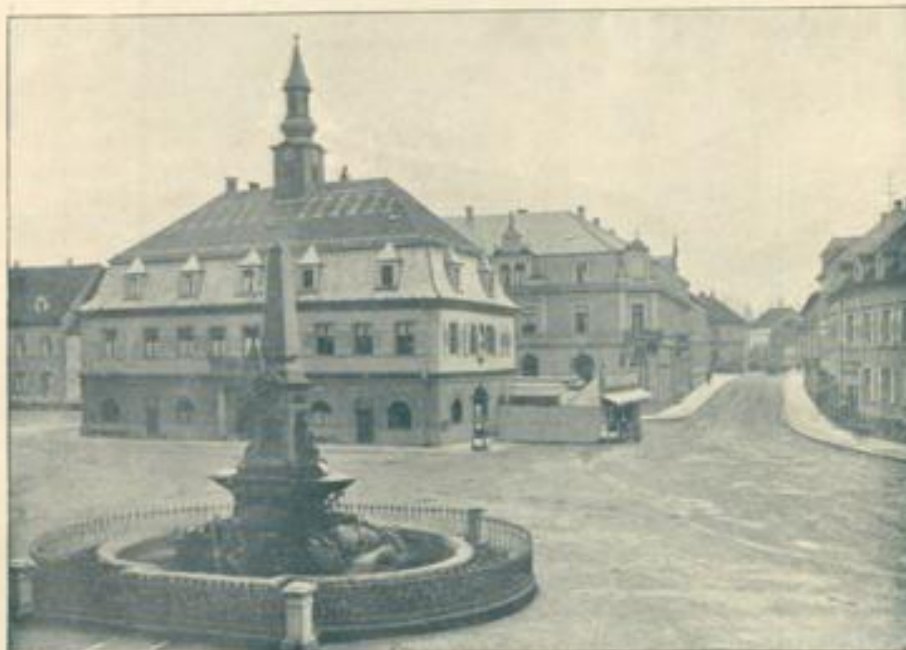
Kriegerdenkmal und Rathaus.

nur wenige Orte Badens, nicht allzuvielen Städte in deutschen Landen mit Emmendingen teilen können. Majestätisch türmt sich links in mächtiger Breite das Massiv des greisbaren nahen trotigen Kandel, des süddeutschen Bloßbergs zum Himmel empor. Gegen Süden aber umfließen, wie die Fürsten des Reichs ihren kaiserlichen Herrn, die Recken des Schwarzwalds ihren König, den Feldberg, welcher, meist noch in blühender Maienzeit mit dem Gernlein des Winters geschmückt, weit über sie empor ragt. Ein prächtiges Farbenspiel erfreut zumal bei schöner Abendbeleuchtung oder herrlichem Früh das Auge. Das dunkle Violett oder tiefe Blau der näheren Bergwände hebt sich malerisch ab von den immer lichter werdenden Farben der entfernteren Kuppen, bis endlich in düstiger Ferne die blaßblauen Gipfel am Horizonte verschwinden. Die Lieblichkeit mit Großartigkeit vereinigenden Haupter des Schaninlands, des Belchens und Planens mit ihren dunklen Tannen und grünen Triten grünen als liebe Bekannte hernieder zu den reben geschmückten Vorbergen und in die grüne Rheinebene durch welche das silberne Band der Elz sich windet.