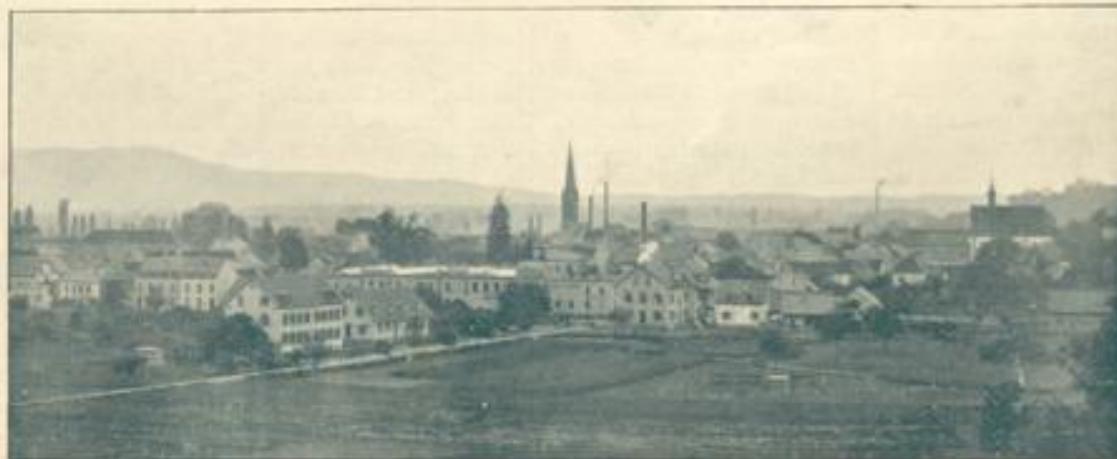
Emmendingen von Osten.

müdigsten Flußstöcher Vater Schwarzwalds rauscht an den Mauern des Städtleins vorüber, den erstaunten Blicken der Anwohner oft zeugend, daß sie trotz der väterlich weisen Führung, welche ihr die Wasserbaubehörden ihres Heimatlands