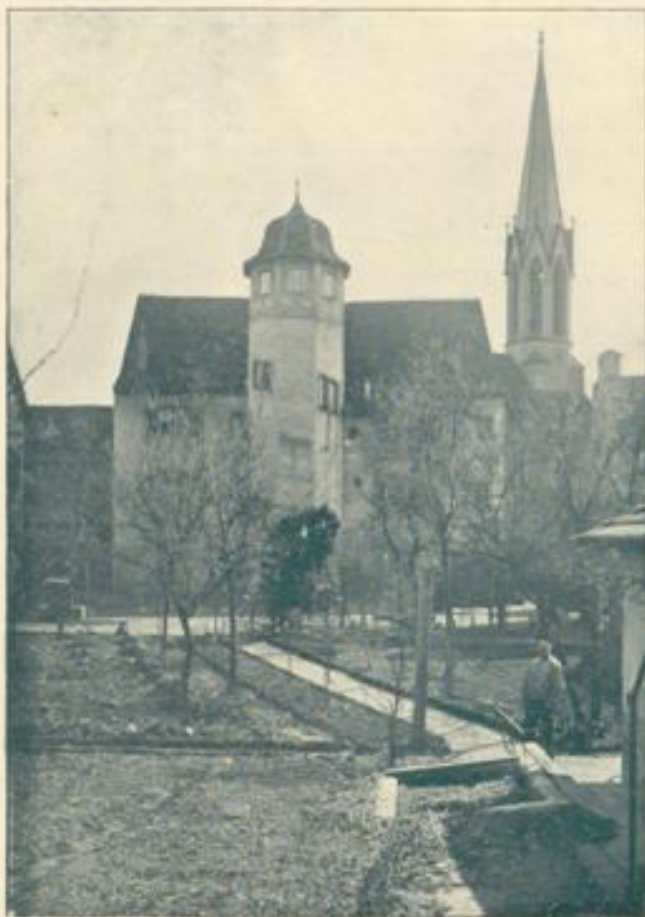
Altes markgräfliches Schloß.

dingen hinauszukartätschen, wobei die Stadt in hoher Gefahr stand, unter dem beiderseitigen Geschüßfeuer in Brand aufzugehen.