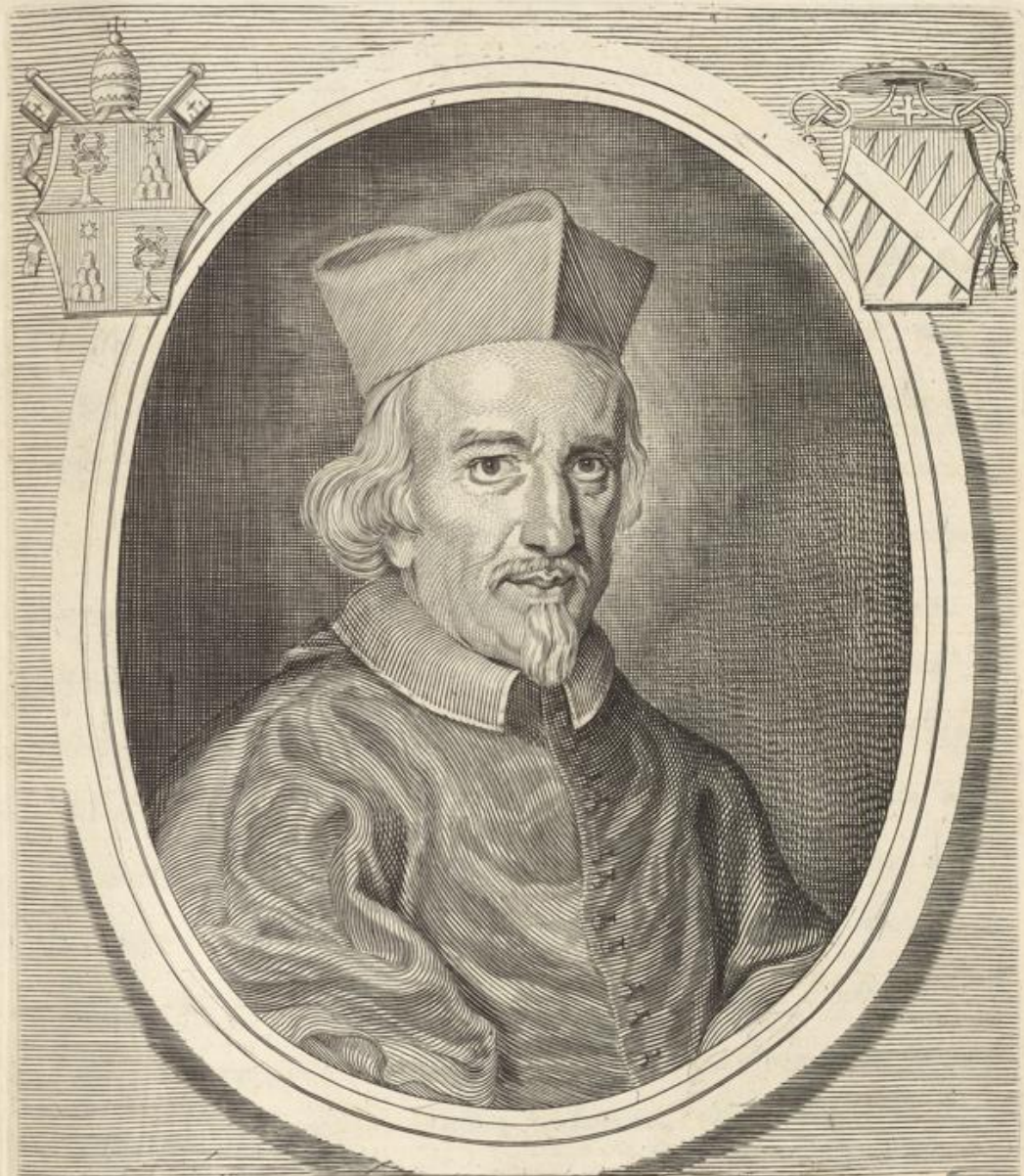
IACOBVS S . R . E . EPISCOPVS CARDINALIS FRANSONVS IANVENSIS CREATVS DIE XXIX . APRILIS MDCLVIII .

Roma ex Officina Domini de Rubis Heredis Io. Iacobi de Rubis ad Temp. S. Mariae de Pace cum Priu. S. P.