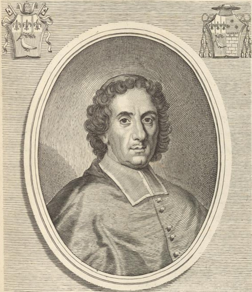
FRANCISCVS S. R. E. PRIOR PRESBYTERIORV. CARD. MAIDALCHINVS . VITERBIEN. CREAT. DIE VII. OCTOBRIS. MDCXLVII.

Joseph Testana lanuen. Delin. et Scul. Io. Iacobus de Rubis Formis Romæ d Temp. Pacis cū Priul. S. Pontif.